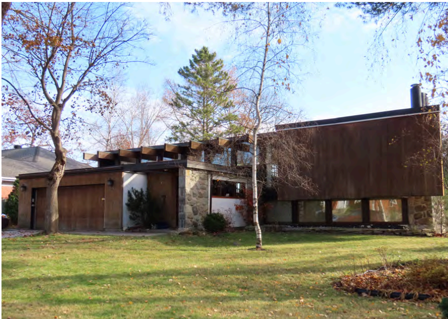
Le 38, chemin des Trilles, érigé vers 1965, un édifice de style Prairie (architecte inconnu).

La topographie de Laval, généralement faite de plaines, offre un lieu de choix pour expérimenter ce style. Dans les secteurs où le couvert végétal est prédominant sur le terrain, on observe une utilisation marquée du bois comme matériau de parement des façades. On peut l'observer à la résidence Papineau (Papineau, 1964) et au 38, chemin des Trilles (architecte inconnu, 1965). Ailleurs, là où le couvert végétal est plus clairsemé ou absent, la pierre est alors plus présente en parement.