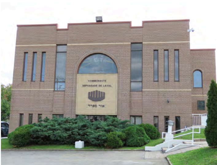
Synagogue Communauté sépharade de Laval, datant de 1982 (architecte inconnu). 4860, boulevard Notre-Dame.