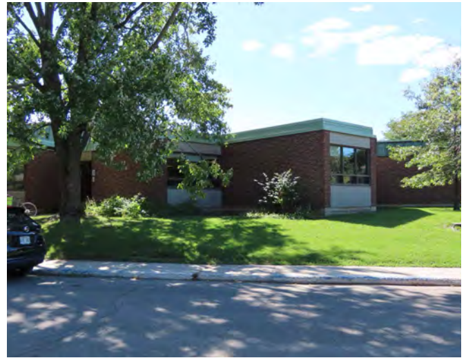
École primaire Val-des-Arbres érigée en 1968. Poulin & Ayotte, architectes. 3145, avenue du Saguenay.

Puisque la forme doit suivre la fonction, on peut discerner les usages de ces bâtiments par une analyse de leur composition. L'expressionnisme formel se remarque par les plans au sol irrégulier et triangulaire de Place Laval et du Centre financier (Des Rochers & Ayotte, 1965).