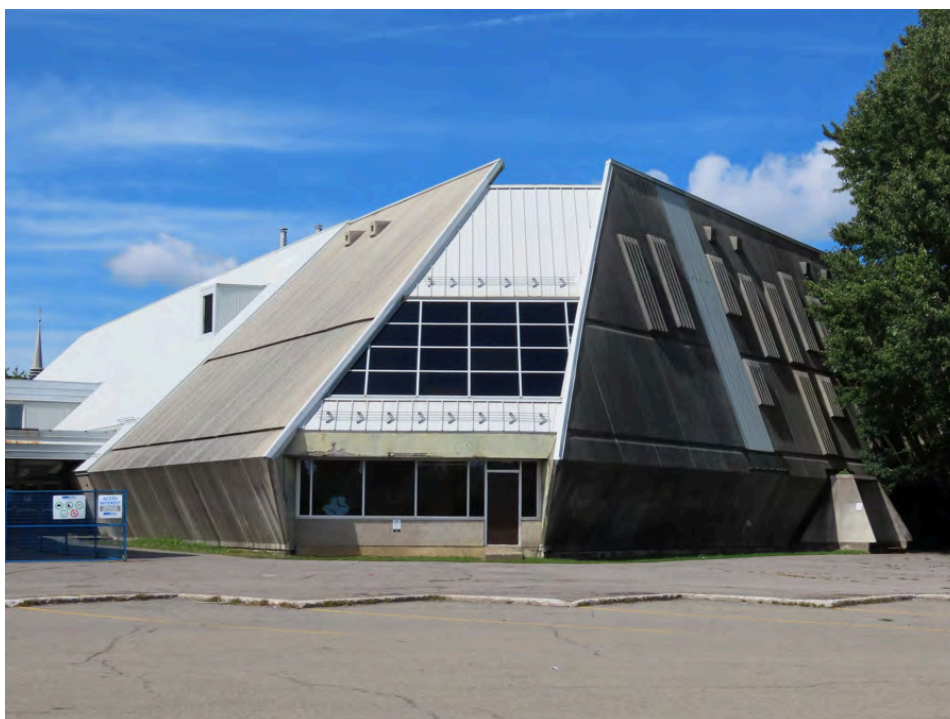
L'annexe moderne de l'école secondaire Saint-Maxime construite en 1971. Pierre Cantin, architecte. 3680 A, boulevard Lévesque Ouest.