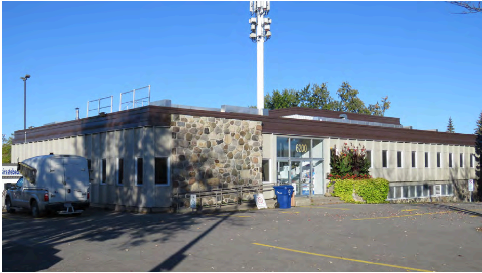
Ancien hôtel de ville d'Auteuil, érigé en 1962. Pierre Cantin, architecte. 6200, boulevard des Laurentides.

L'architecture moderne laisse une grande place à la créativité artistique des architectes. Le traitement des composantes, telles que les pilotis, les ouvertures en bandeau et la disposition des volumes, permet de créer des réalisations uniques. Durant les années 1960, des municipalités situées aux quatre coins de la province se dotent de nouvelles infrastructures municipales. Par exemple, des villes telles que Dolbeau au Lac-Saint-Jean (St-Gelais, Tremblay, Tremblay, 1962), Trois-Rivières en Mauricie (Leclerc et Villemure, 1967-1968), Sillery à Québec (Venne, 1965), Val-d'Or en Abitibi-Témiscamingue (Monette, Saint-Denis et Associés, 1964) ou encore Tracy en Montérégie (Racicot, 1966) optent pour le style international pour leur complexe municipal. Ainsi, ce qui est observé à Laval s'étend aux quatre coins de la province.