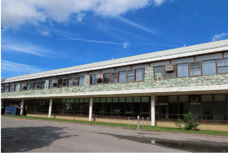
École secondaire Saint-Maxime, construite en 1963 selon les plans de l'architecte Pierre Cantin. Exemple d'architecture institutionnelle de style international. 3680, boulevard Lévesque Ouest.

publique comme l'école secondaire Saint-Maxime (Cantin, 1963) et l'ancien hôtel de ville d'Auteuil (Cantin, 1962). Bien qu'ils présentent tous des caractéristiques similaires associées aux bâtiments d'influence moderne du style international, chacun se distingue des autres.