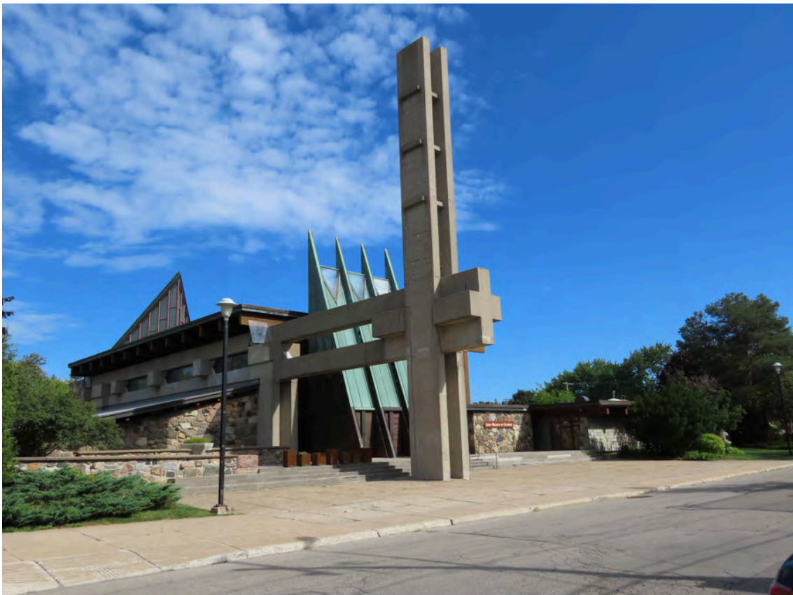
Église Saint-Maurice-de-Duvernay, érigée entre 1961 et 1962, unique par son architecture à l'échelle du Québec. Roger D'Astous, architecte. 1961, rue d'Ivry.

Dans le patrimoine moderne religieux lavallois, le fonctionnalisme, l'expressionnisme formel et le style international sont très présents. Dans certains cas, il est difficile d'identifier une influence stylistique dominante, puisque l'architecture des églises reste somme toute conservatrice. Ainsi, on peut distinguer qu'il s'agit d'une église même si elle présente une architecture moderne. Ces églises peuvent également entrer dans la catégorie du fonctionnalisme. Néanmoins, les architectes du modernisme adaptent l'esthétisme religieux aux formes modernes. Par exemple, l'église Saint-Maurice-de-Duvernay (D'Astous, 1961-1962) est jugée de valeur patrimoniale exceptionnelle en plus d'être considérée comme incontournable par le Conseil du patrimoine religieux du Québec.