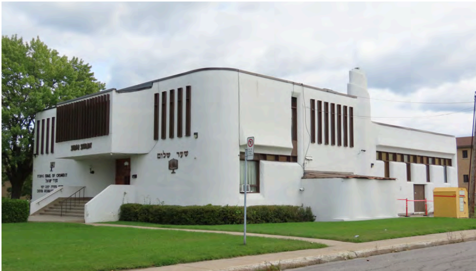
Synagogue Shaar Shalom, érigée entre 1964 et 1966. Warshaw, Swartzman and Borrow, architectes. 4880, boulevard Notre-Dame.