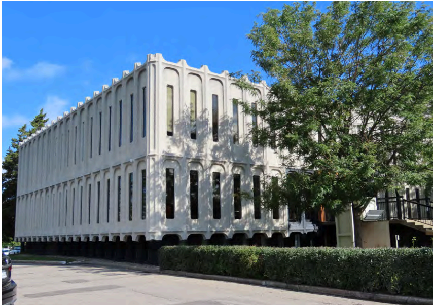
Édifice Berthelo datant de 1970. Guillaume Gagnon, architecte. 3333, boulevard du Souvenir.

L'emploi et le traitement du béton dans l'architecture brutaliste permettent aux architectes de réaliser des bâtiments qui se distinguent les uns des autres. En effet, la grande malléabilité plastique qu'offre le béton permet d'innover et d'améliorer les formes parfois jugées austères de l'architecture brutaliste. Plusieurs bâtiments du corpus institutionnel moderne de Laval sont de cette influence : l'hôtel de ville de Laval (Affleck, Desbarats, Dimakopoulos, Lebensold & Sise, 1963-1964), l'école Poly-Jeunesse (Moreau, Des Rochers & Dumont, 1973-1976) et l'édifice Berthelo (Guillaume Gagnon, 1970).