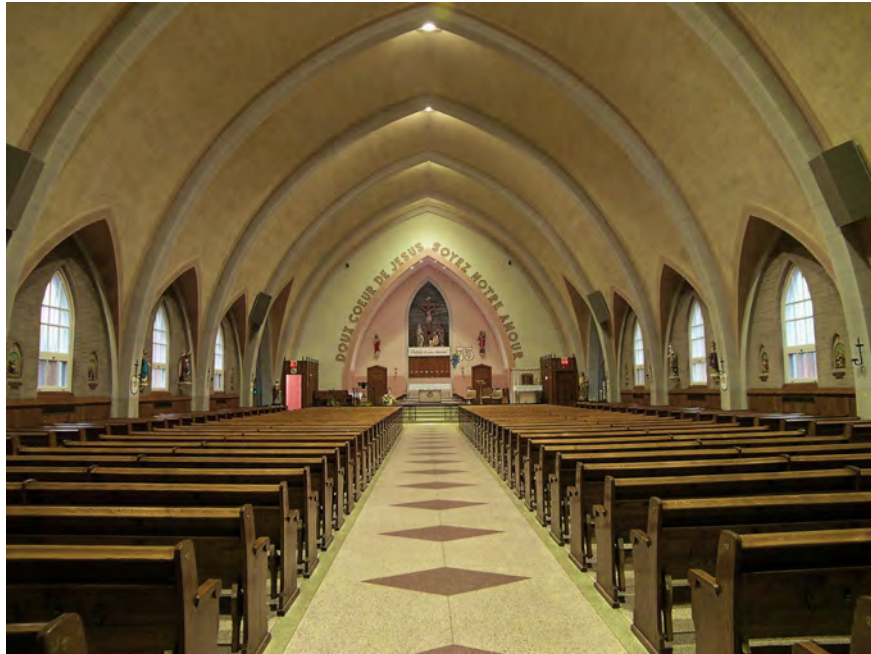
Intérieur de l'église Saint-Maxime. Nef et arc brisé de la voûte. 2003-13- 029-30-01