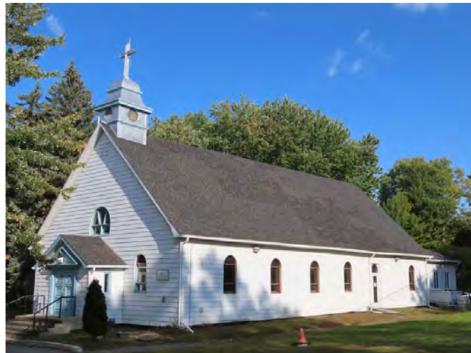
Église Notre-Dame-de-l'Espérance, construite vers 1950, l'un des bâtiments associés au patrimoine traditionnel. 891, chemin de la Fourche.