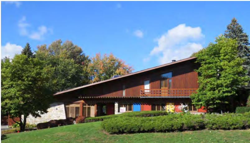
Édifice Alexandre-Riccio, érigé par Roger D'Astous entre 1976 et 1977. L'un des immeubles marquants du patrimoine moderne lavallois. 90, rue Les Érables.