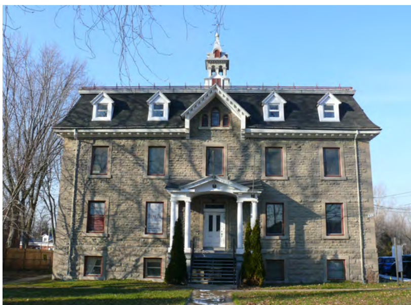
Ancien couvent des Sœurs de Sainte-Croix, construit en 1875-1876. 233, boulevard Sainte-Rose.