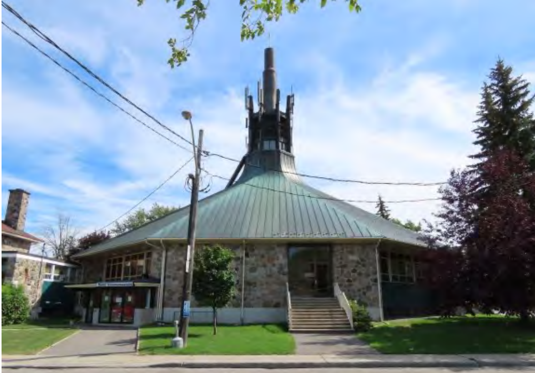
Église Saint-Noël-Chabanel érigée entre 1961 et 1964 selon les plans d'André Ritchot. 8560, rue de l'Église.

Dérivé du fonctionnalisme par la nef rectangulaire et le clocher de béton, l'église révèle une certaine influence de l'expressionnisme formel par le jeu des formes géométriques, de même que du style Prairie par l'horizontalité du bâtiment, son toit à faible inclinaison et la diversité des matériaux des façades. L'église Saint-Noël-Chabanel (Ritchot, 1961-1964) et l'église Saint-Pie-X (Des Rochers & Dumont, 1959-1960) à plan semi-circulaire sont davantage associées à l'expressionnisme formel. L'une des caractéristiques de l'architecture religieuse moderne est la place laissée à la lumière naturelle à l'intérieur de l'église.