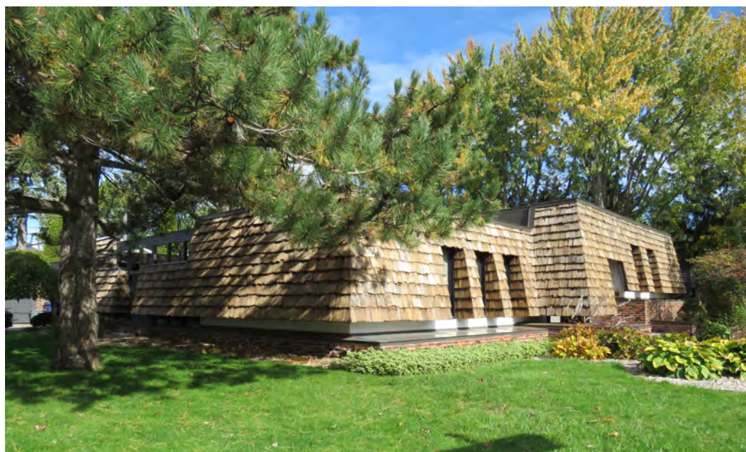
Le 1915, rue Champfleury, érigé en 1965. Exemple d'architecture rustique moderne. Poulin et Ayotte, architectes.