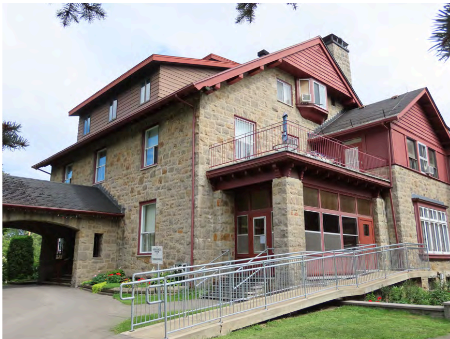
Maison mère des Sœurs missionnaires du Christ-Roi, érigée en 1940. 4730, boulevard Lévesque Ouest.

L'église Saint-Maxime (Perrault, 1948-1949) illustre le régionalisme et le dombellotisme. À l'extérieur, elle présente plusieurs similitudes avec l'église Sainte-Dorothée (Bourgeau, 1871-1873), dont le parement extérieur est en pierre. L'intérieur reprend les préceptes de Dom Bellot avec des teintes de couleurs claires et variées pour les éléments structuraux, dont les arcs brisés.