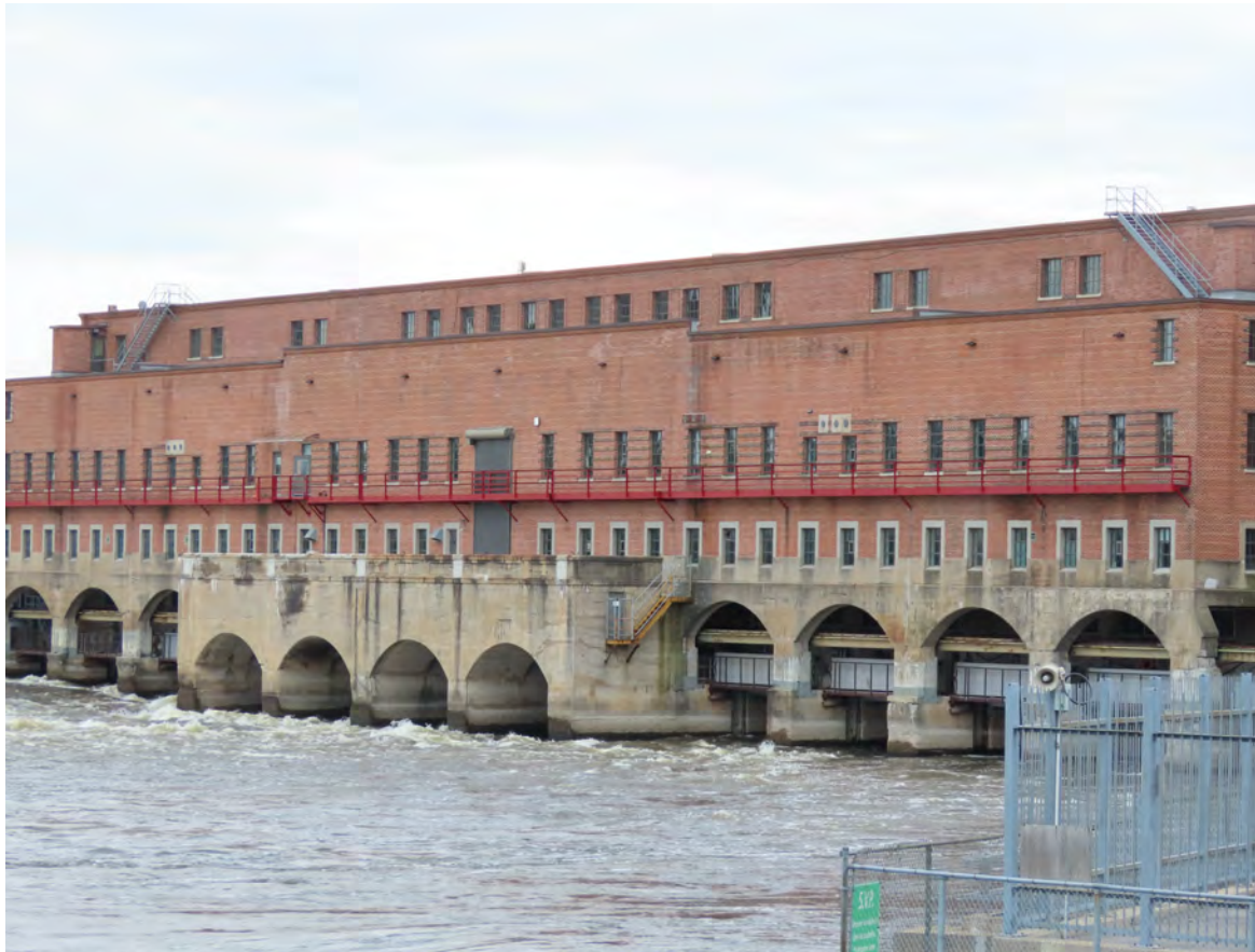
Partie ancienne de la centrale de la Rivière-des-Prairies (section nord). Shorey and Ritchie, architectes. L'un des quatre biens à valeur patrimoniale exceptionnelle. 3400, rue du Barrage