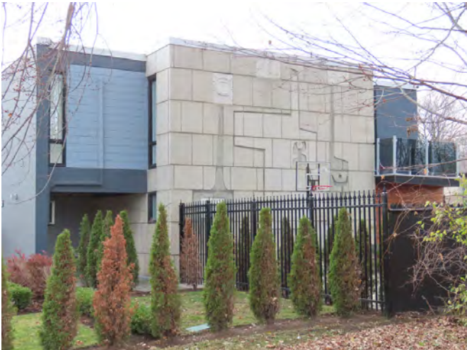
L'une des murales du sculpteur Charles Daudelin de la maison tout béton, 2266, rue Brahms,

Ce qui distingue le corpus moderne de la ville de Laval de celui du reste du Québec réside en l'apport d'artistes dans la conceptualisation des bâtiments. En effet, Laval possède un bon éventail d'immeubles présentant des œuvres d'art intégrées à l'architecture. Par exemple, la maison tout béton (Lalonde, 1962-1963), au 2266, rue Brahms comprend deux murales en relief du sculpteur Charles Daudelin, intégrées aux façades extérieures.