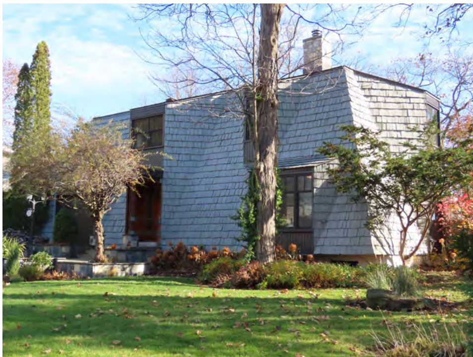
Le 89, rue Comtois, érigé en 1965. Exemple d'architecture rustique moderne. Architecte inconnu.