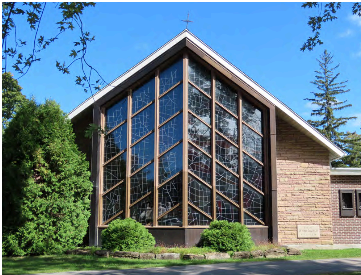
Église Saint-Jean-Gualbert, construite entre 1953 et 1954. Crevier, Bélanger & Mercier, architectes. 490, rue Les Érables.

Pour ce faire, certaines églises modernes de Laval présentent en façade une grande verrière triangulaire. C'est le cas notamment des églises Saint-Sylvain (Ritchot, 1965-1966), Sainte-Béatrice (Ritchot, 1962-1964), Bible Evangelical Baptist Church (Moreau, 1957-1958) et Saint-Jean-Gualbert (Crevier, Bélanger & Mercier, 1953-1954).