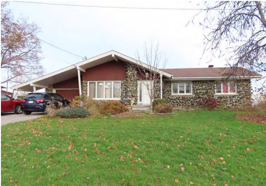
Le 45, rue Paré, un bungalow érigé en 1967 (architecte inconnu).

Les bungalows implantés à Laval restent similaires à ceux implantés ailleurs au Québec. Les plans publics de ces maisons unifamiliales permettent la prolifération des différents modèles un peu partout au Québec. La similitude réside non seulement dans la forme architecturale, mais également dans le mode d'implantation. Il n'est pas rare de retrouver sur une même rue ou dans un secteur particulier une typologie de bungalow créant ainsi un ensemble homogène dans les périphéries des zones urbaines. Le territoire de Laval possède quelques ensembles de ce type, dont celui de l'avenue du Crochet, entre le boulevard des Prairies et la rue Francois-Souillard. Plusieurs de ces bungalows sont réaménagés ou modifiés au fil des années afin de répondre aux besoins des différents occupants.