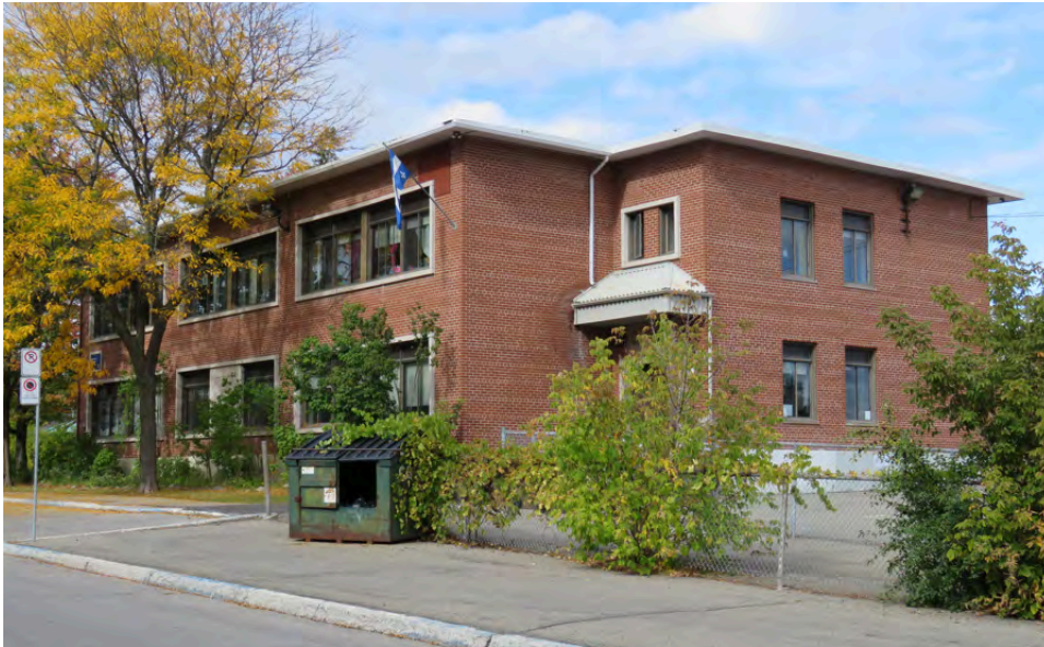
Pavillon nord de l'école Raymond. 5505, 27 e Avenue.