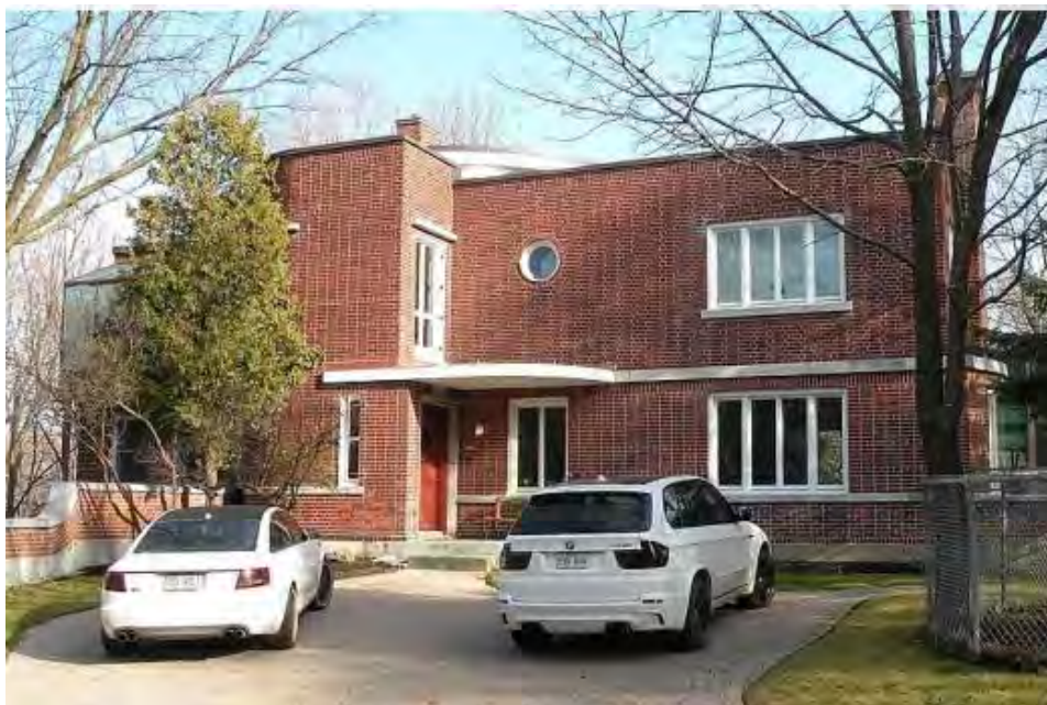
Maison Greenshields, 2801, Hill Park Circle, Montréal.

Enfin, il faut mentionner parmi les immeubles pionniers du style international au Québec le centre commercial du Domaine-de-l'Estérel. Bien qu'il n'ait pas une fonction résidentielle, il est conçu par l'architecte belge Antoine Courtens et est érigé entre 1936 et 1939 au sein d'un complexe de villégiature élaboré par le baron Louis Empain 3 .