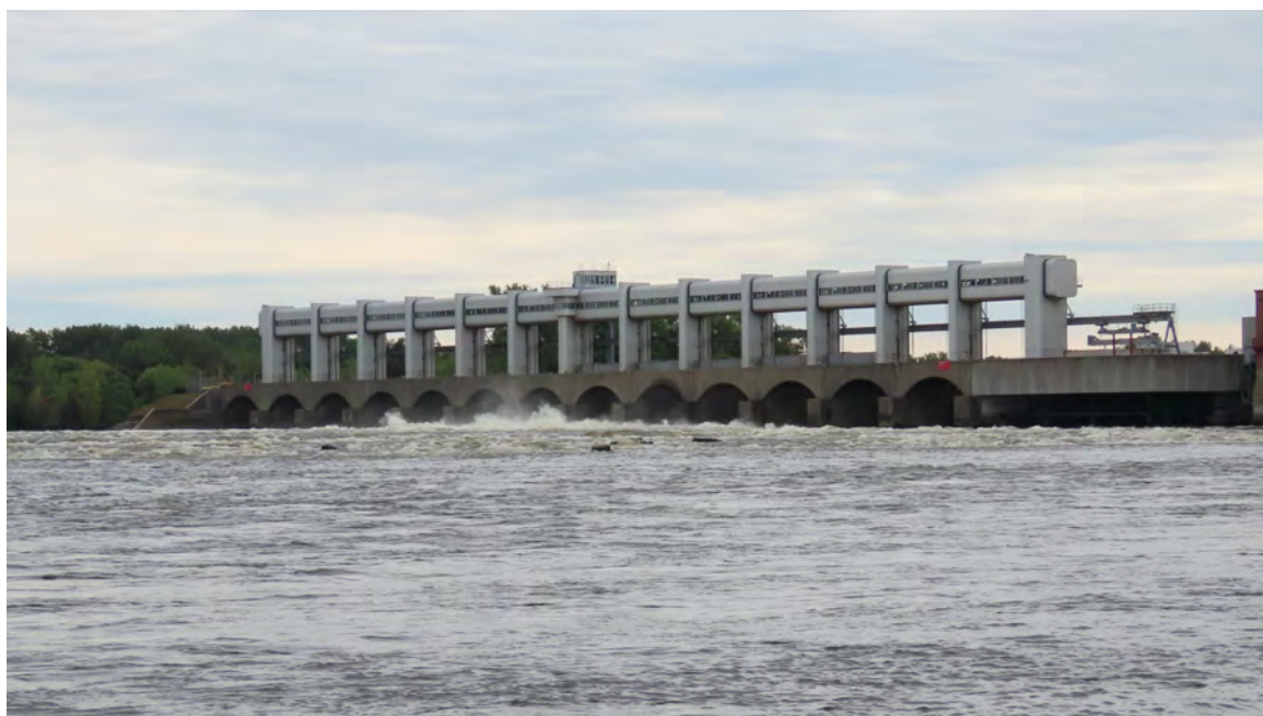
Évacuateur de crues (section sud) du barrage de la Rivière-des-Prairies, construit en 1984, sur la rivière du même nom. Il comprend une succession d'arches de béton au-dessus desquelles se trouvent les portiques d'acier contenant les équipements de levage des portes de l'évacuateur de crues.