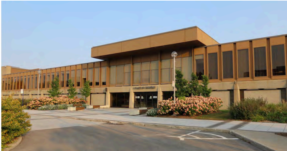
Façade principale de l'hôtel de ville de Laval, érigé entre 1963 et 1964. Affleck, Desbarats, Dimakopoulos, Lebensold & Sise, architectes. 1, place du Souvenir.

L'hôtel de ville de Laval (Affleck, Desbarats, Dimakopoulos, Lebensold & Sise, 1963-1964), l'annexe moderne de la polyvalente Saint-Maxime (Cantin, 1971) et le complexe funéraire Alfred-Dallaire (Ritchot, 1979) présentent tous une architecture massive en béton.