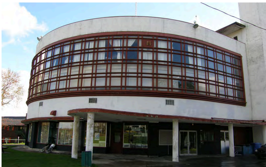
Centre commercial du Domaine-de-l'Estérel. Un site patrimonial classé. 414, rue du Baron-Louis-Empain, Sainte-Marguerite-du-Lac-Masson.

Enfin, il faut mentionner parmi les immeubles pionniers du style international au Québec le centre commercial du Domaine-de-l'Estérel. Bien qu'il n'ait pas une fonction résidentielle, il est conçu par l'architecte belge Antoine Courtens et est érigé entre 1936 et 1939 au sein d'un complexe de villégiature élaboré par le baron Louis Empain 3 .