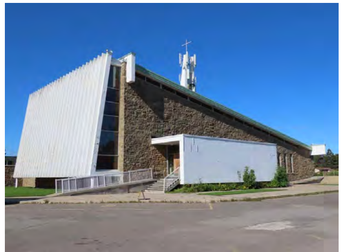
Chœur et élévation latérale gauche. Église Saint-Théophile. . 6000, 31 e Avenue. Jacques Vincent et Jean Damphousse, architectes.