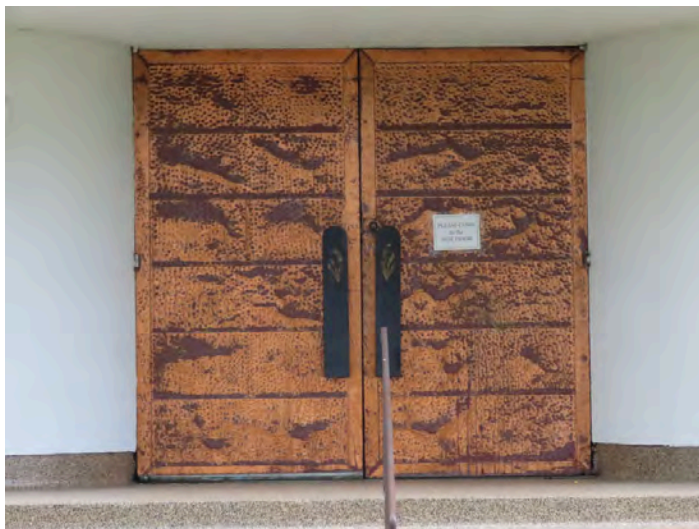
Portail de la synagogue Shaar Shalom avec portes en étain. 4880, boulevard Notre-Dame.