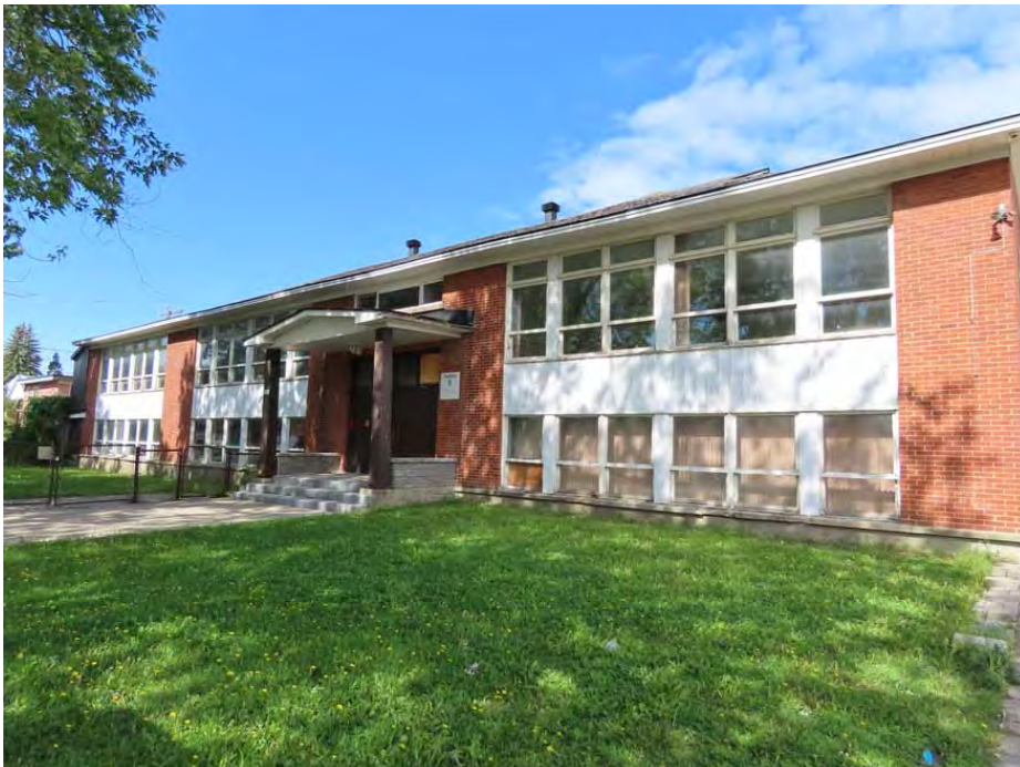
Pavillon B de l'école Notre-Dame de Nareg, l'une des écoles lavalloises influencées par le courant fonctionnaliste. 555, 77 e Avenue.