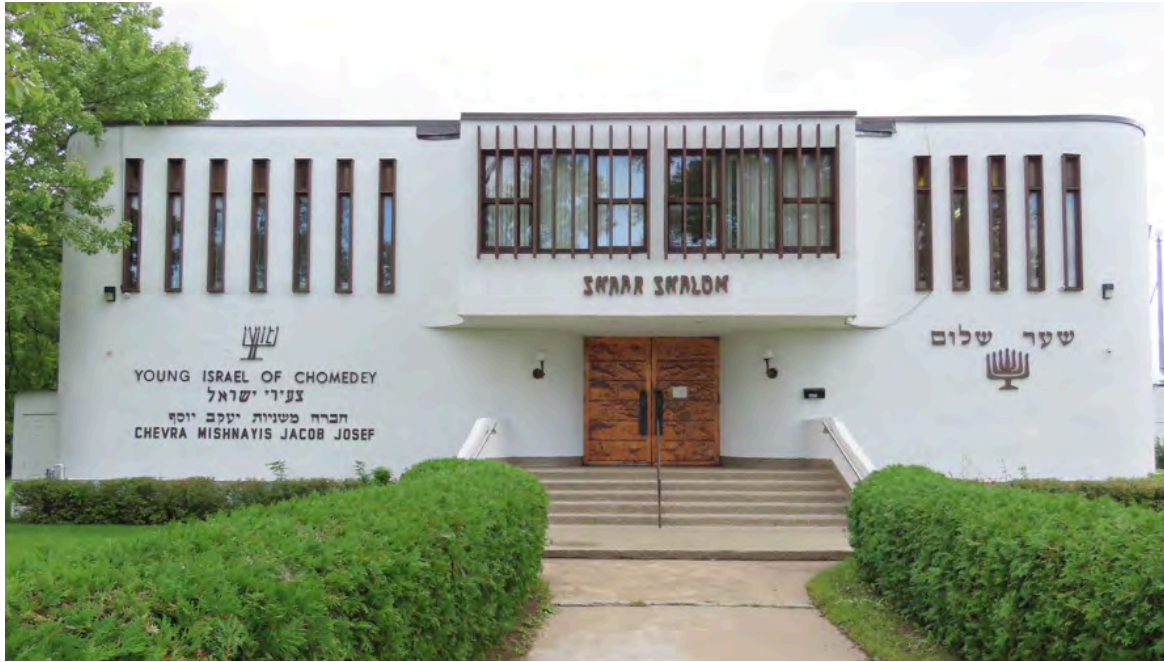
Synagogue Shaar Shalom construite en 1964-1966, Warshaw, Swartzman and Borrow, architectes. 4880, boulevard Notre-Dame.

Toutefois, cette composante n'est pas unique aux églises modernes de Laval. En effet, on la retrouve sur plusieurs autres églises de la même époque, dont l'église Saint-Marc (Côté, 1955-1956) à Saguenay ou encore l'église Saint-Bernardin-de-Sienne (Duplessis, Labelle & Derome, 1955-1956) à Montréal. La synagogue Shaar Shalom (Warshaw, Swartzman and Borrow, 1964-1966) présente une influence plus près du style international. Elle se distingue notamment par des surfaces extérieures lisses en crépi blanc et par le dépouillement ornemental. Elle possède un intérêt dépassant les limites de la ville de Laval.