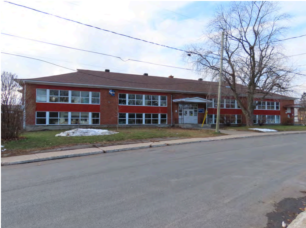
École primaire Léon-Guilbault 1 (architecte inconnu, 1966). 14, rue Émile.