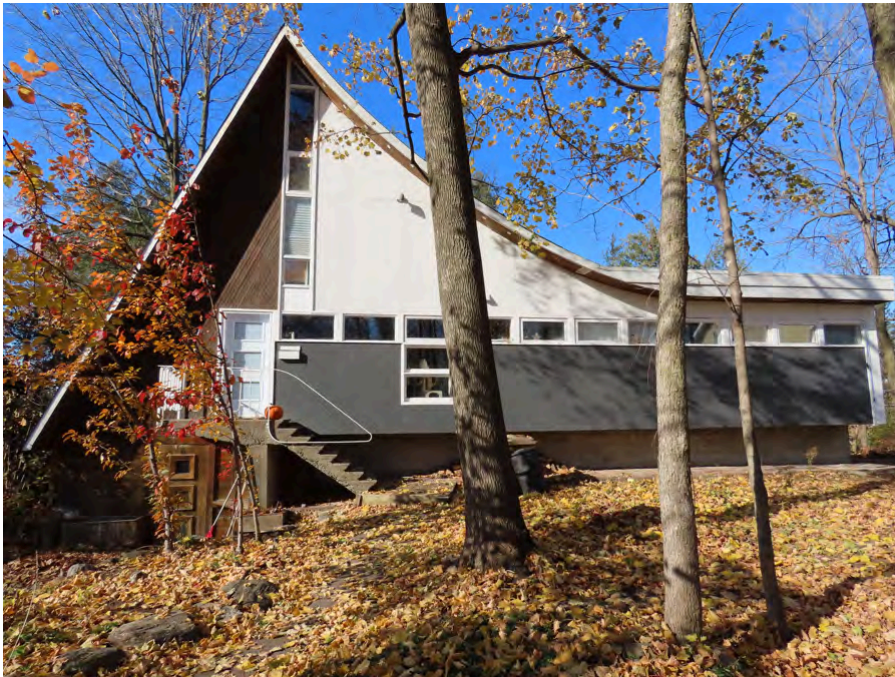
Le 21, chemin des Trilles, datant de 1962. Architecte inconnu.

À Laval, le style rustique moderne s'implante à plusieurs endroits sur le territoire de l'île Jésus. Dans Laval-sur-le-Lac, le style est représenté par la maison Alexandre-Riccio (D'Astous, 1976-1977), dans Duvernay, par le 1915, rue Champfleury (Poulin & Ayotte, 1965) et dans les Îles-Laval, avec quelques résidences, notamment sur le chemin des Trilles, dont le numéro 40 (architecte inconnu, 1968) et le numéro 21 (architecte inconnu, 1962)