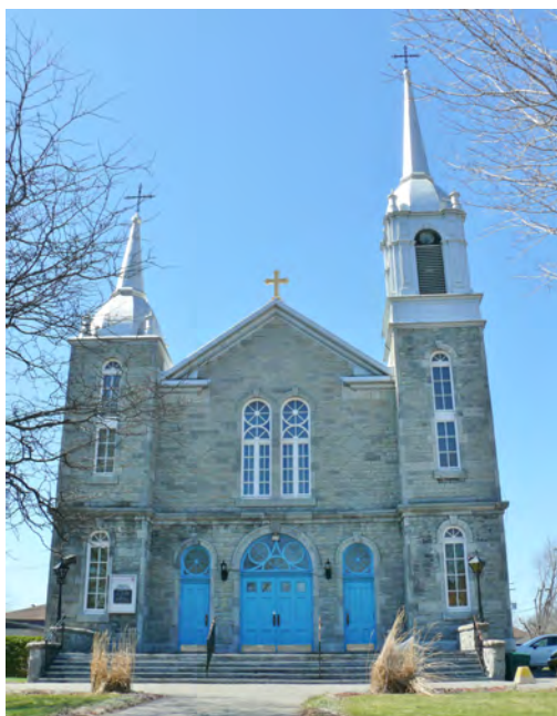
Église Saint-Elzéar, construite en 1917-1919. 16, boulevard Saint-Elzéar Est.

À notre corpus d'étude, nous avons ajouté, à la demande de la Ville de Laval, 47 biens associés au patrimoine traditionnel, ayant déjà fait l'objet d'un inventaire. Ces biens n'ont pas été analysés dans le cadre du présent mandat mais simplement ajoutés à notre banque de données. En voici deux exemples.