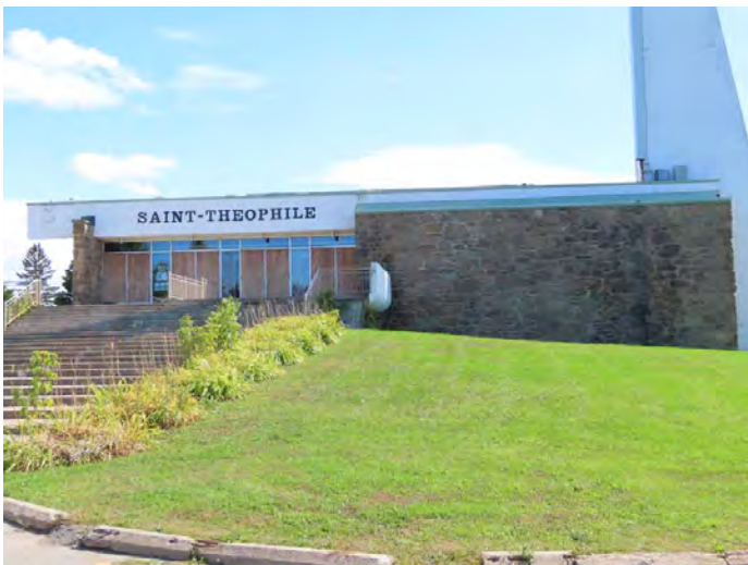
Façade principale. Église Saint-Théophile. 6000, 31 e Avenue. Jacques Vincent et Jean Damphousse, architectes.

La forme du clocher ajoute à sa singularité. Situé à l'extrémité nord-ouest de l'église, il repose sur une structure de béton à deux pans parallèles, de forme trapézoïdale, retenus perpendiculairement par des cloisons formant la chambre des cloches. Cette forme trapézoïdale évoque la pente du toit de l'église. Exception faite du mur sud, les élévations sont recouvertes de pierre de taille, aux formats variés et d'un amalgame plutôt aléatoire. Au-dessus du mur est, d'étroites fenêtres en bandeau continu font en quelque sorte le lien entre la façade et le chœur. L'extrémité des murs latéraux s'ouvre sur des verrières qui donnent sur le chœur.