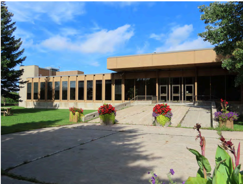
Élévation arrière de l'hôtel de ville de Laval donnant sur la place publique, conçue de façon à constituer l'entrée principale.