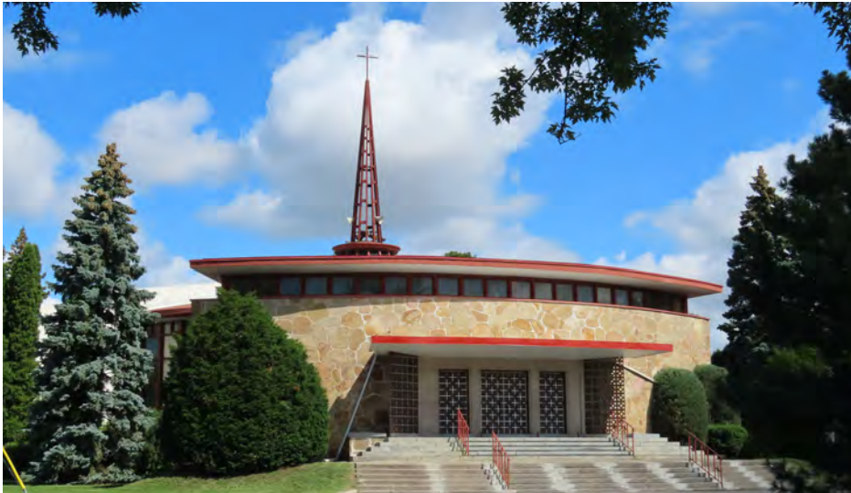
Église catholique Saint-Gilles, érigée en 1960. Édifice associé au courant moderniste fonctionnaliste à valeur patrimoniale supérieure, remarquable par son plan circulaire. Jean Charbonneau, architecte. 231, rue des Sables.

Le corpus de biens associés à la fonction religieuse (d'origine) offre une très grande qualité car 30 d'entre eux présentent une valeur patrimoniale supérieure, alors qu'une église détient une valeur patrimoniale exceptionnelle (Saint-Maurice-de-Duvernay).