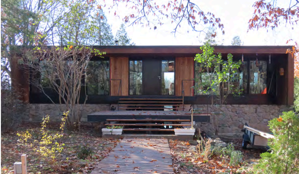
Le 48, chemin des Trilles, érigé en 1964. Édifice de style Prairie à valeur patrimoniale supérieure. Louis-Joseph Papineau, architecte (Papineau, Gérin-Lajoie, Leblanc, architectes).

En termes d'importance quantitative vient ensuite la fonction résidentielle regroupant 66 édifices. Il s'agit presque essentiellement de résidences unifamiliales, pour la plupart remarquables par la qualité de leur composition architecturale, ayant été conçues en bonne partie par des architectes réputés. Ces résidences témoignent d'une diversité de styles architecturaux, représentatifs des décennies 1950, 1960 et 1970, notamment le style Prairie.