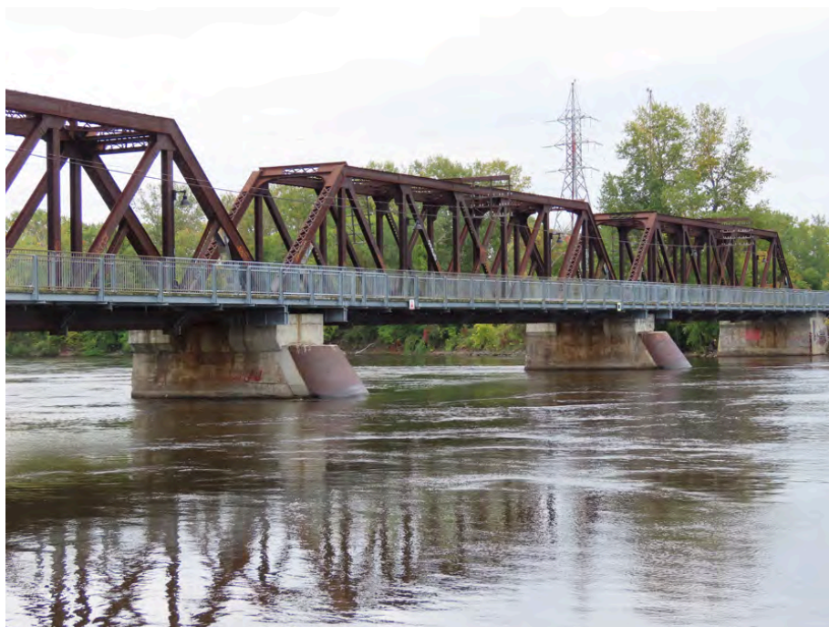
Pont ferroviaire Bordeaux-Laval-des-Rapides, érigé en 1879, ce qui en fait le plus ancien pont lavallois. Il est l'un des quatre ponts ferroviaires lavallois faisant partie du corpus d'étude, les autres étant des ponts routiers.