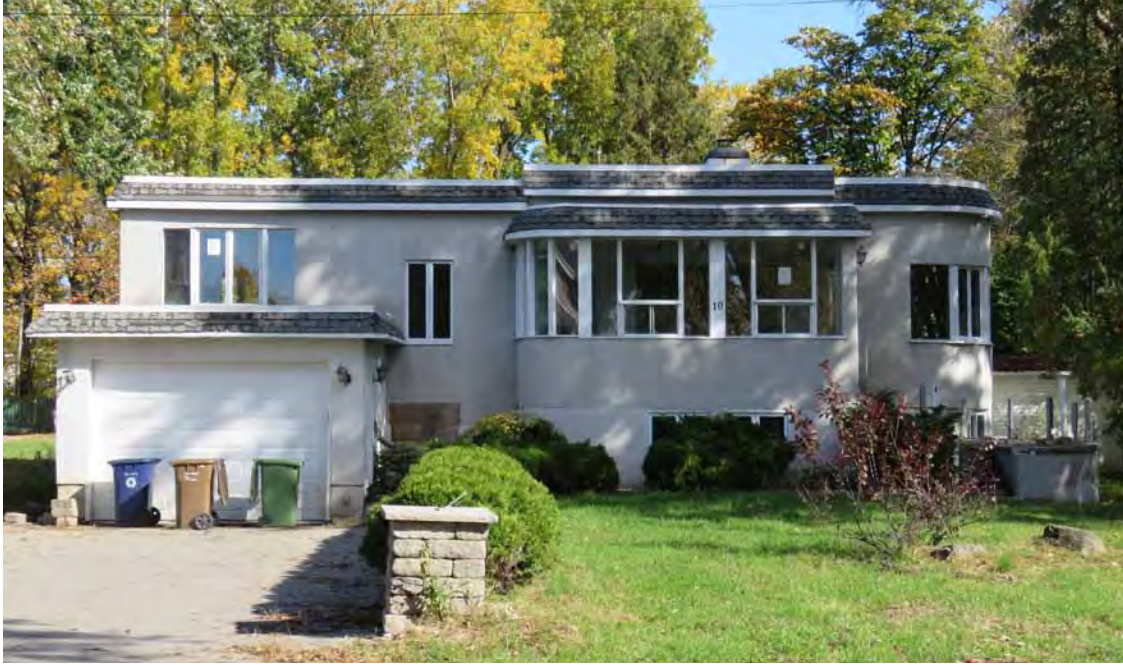
Le 10, rue Les Plaines, construit en 1940 à l'initiative du restaurateur d'origine française André Bertheau. Architecte inconnu. Laval-sur-le-Lac.

Provenant de l'Europe, le style international propose des volumes qui cherchent à mettre en valeur une géométrie pure. Ces immeubles à toit plat sont généralement parés de stuc, permettant ainsi d'uniformiser les façades.