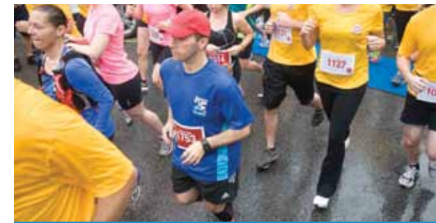
GRANDE FÊTE DES POMPIERS