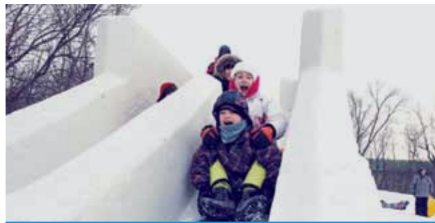
LA GRANDE FÊTE DE L'HIVER