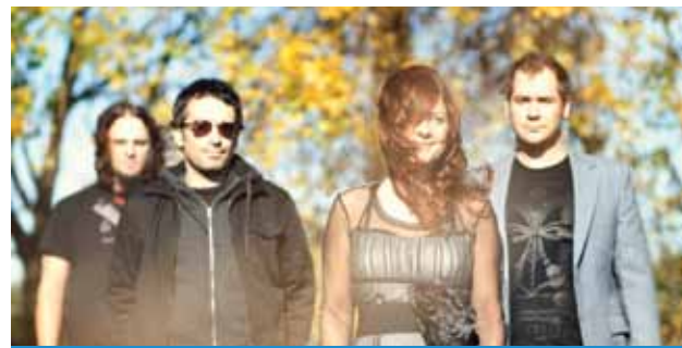
LES COWBOYS FRINGANTS