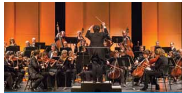
ORCHESTRE SYMPHONIQUE DE LAVAL