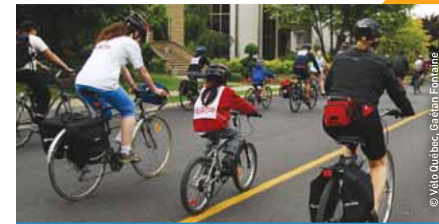
FÊTE DE LA FAMILLE