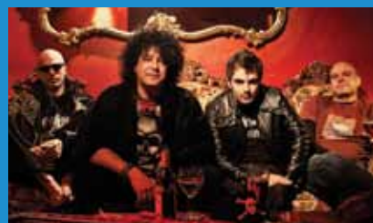
Les Porn Flakes

Décompte du nouvel an et feux d'artifice !