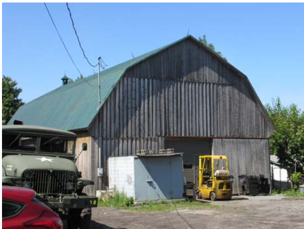
5221, rang du Bas-Saint-François (Duvernay).