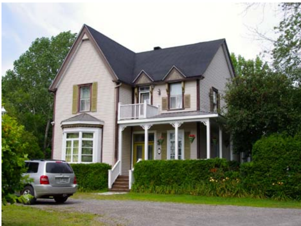
211-215, rue Principale (Sainte-Dorothée).