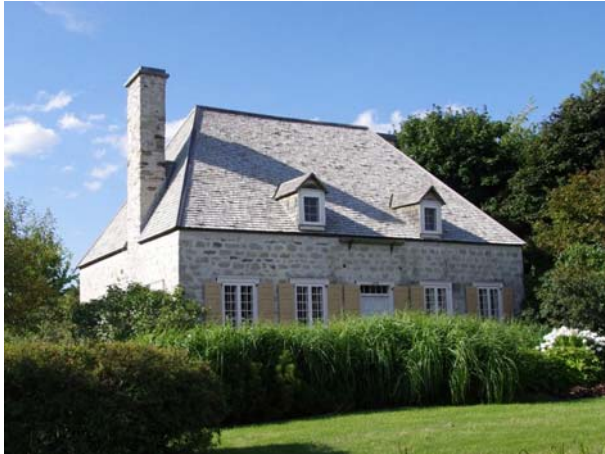
Maison André-Benjamin-Papineau, 5475, boulevard Saint-Martin Ouest (Chomedey).