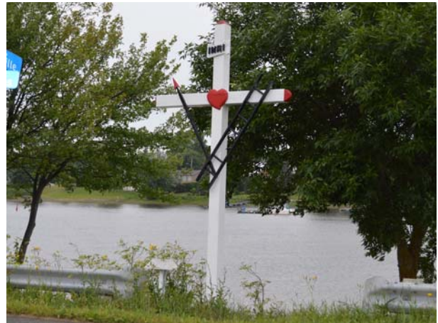
Croix de chemin dotée d'un Sacré-Cœur et d'instruments de la passion (échelle et lance). 9860, boulevard des Mille-Îles (Saint-François).