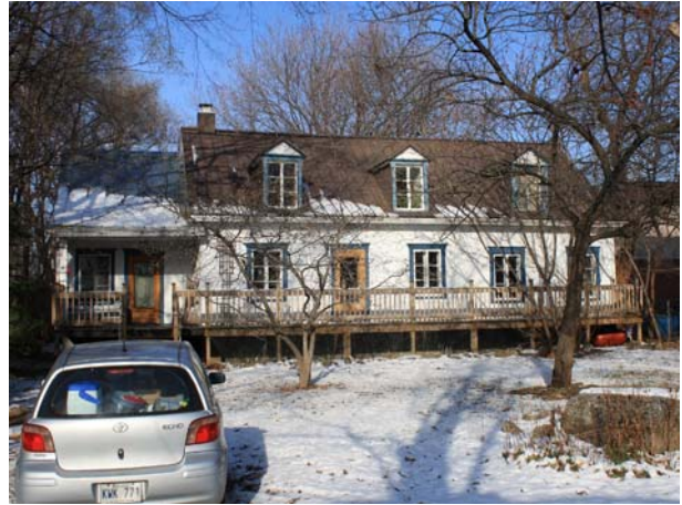
3685, boulevard Lévesque Ouest (Chomedey), vers 1854.