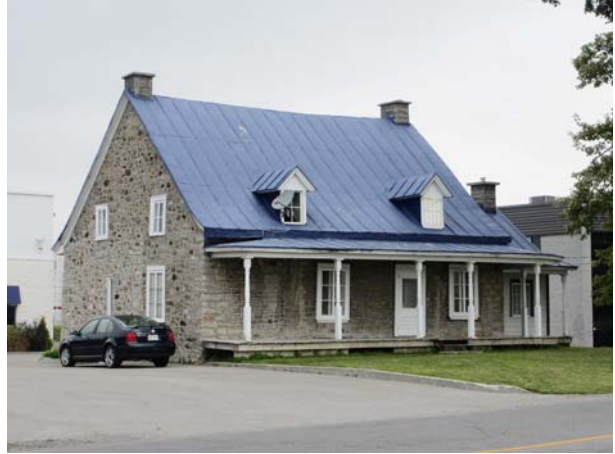
205, boulevard Saint-Elzéar Ouest (Vimont), vers 1865.