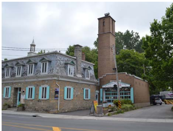
Ancienne école qui a déjà accueilli une centrale téléphonique, un bureau de poste, un poste de police et de pompiers et une mairie, 214, boulevard Sainte-Rose (Sainte-Rose).