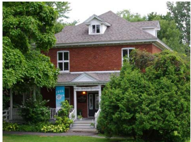
520, boulevard des Prairies (Laval-des-Rapides).