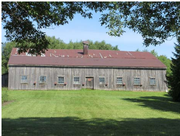
5751, rang du Bas-Saint-François (Duvernay).