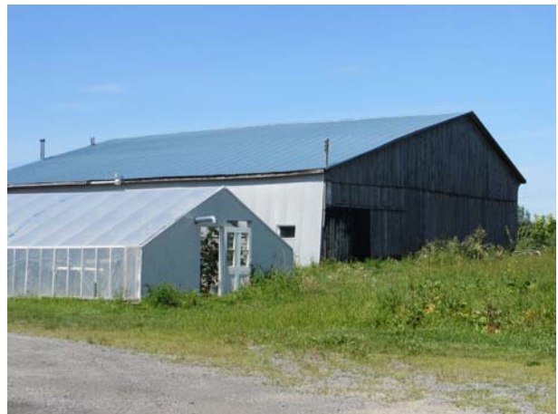
4269, rang du Haut-Saint-François (Duvernay).