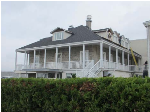
Maison du Cap-Saint-Martin, 1487, boulevard des Laurentides (Vimont).