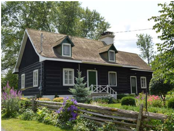
636, boulevard des Mille-Îles (Auteuil), vers 1850.