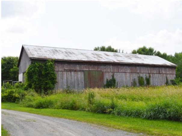
795, boulevard des Mille-Îles (Auteuil).