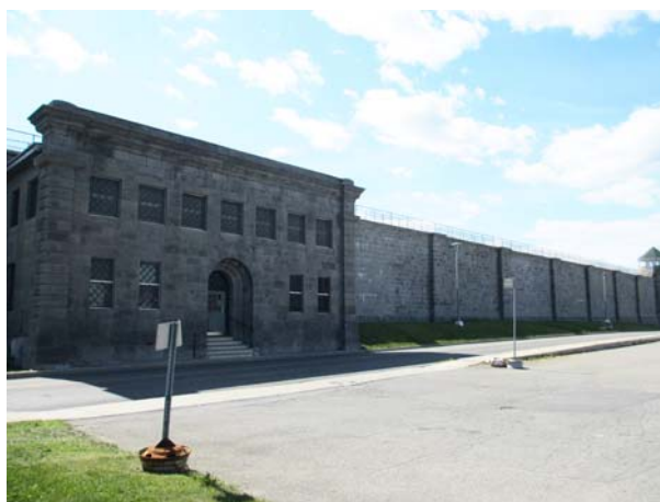
Ancien pénitencier Saint-Vincent-de-Paul, 180, montée Saint-François (Saint-Vincent-de-Paul).