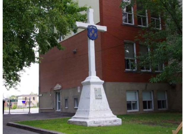
Croix Jacques-Cartier, 1595, rue du Couvent (Chomedey).