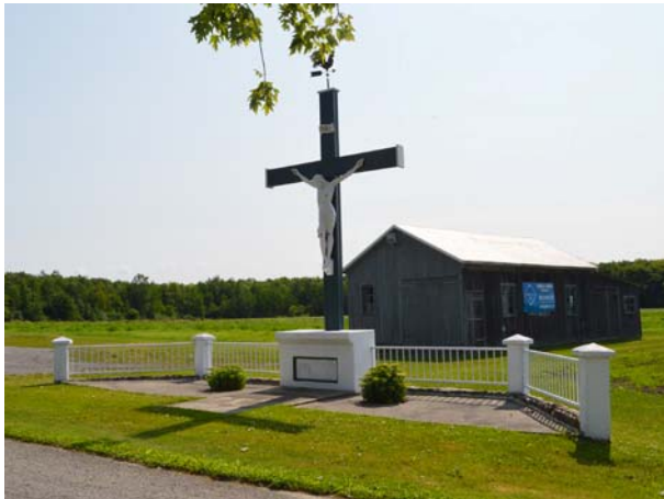
Calvaire doté d'un Christ en croix, d'une girouette et d'un aménagement paysager. 2545, montée des Lacasse (Auteuil).