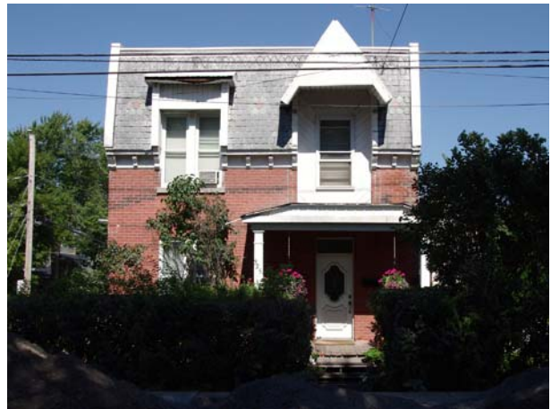
325, boulevard des Prairies (Laval-des-Rapides).