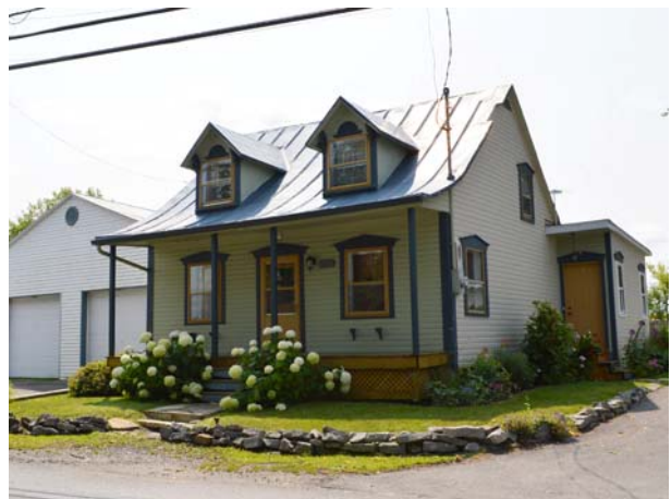
6500, boulevard des Mille-Îles (Saint-François), vers 1890.