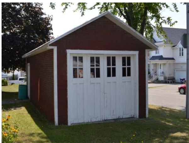
Garage, 3644, boulevard Sainte-Rose (Fabreville).