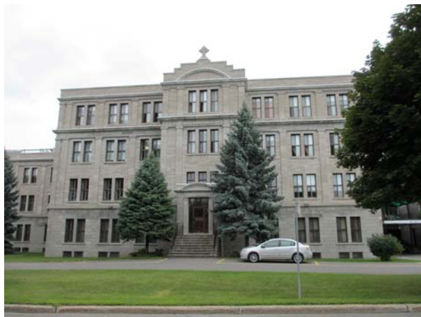
Résidence des Sœurs missionnaires de l'Immaculée-Conception, 100-140, place Juge-Desnoyers (Pont-Viau).