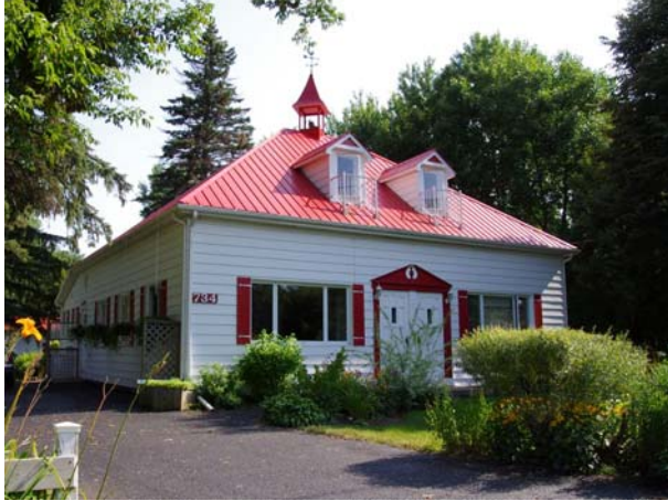
Ancienne école de rang, 734-736, rang Saint-Antoine (Sainte-Dorothée).