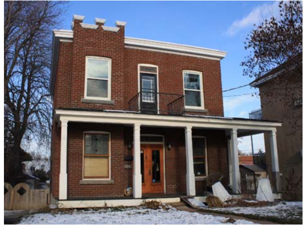
331-331A, boulevard des Prairies (Laval-des-Rapides).