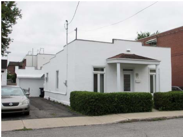
65, rue de Berri (Pont-Viau).