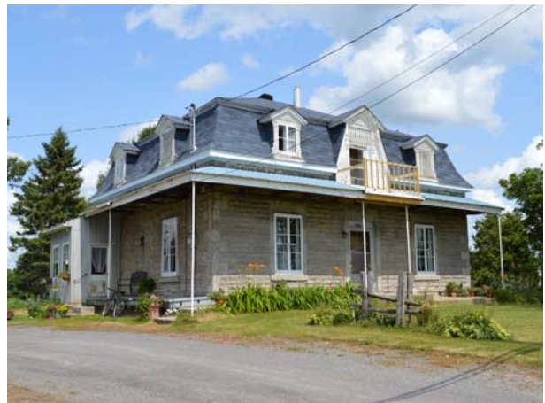
2985, avenue des Perron (Auteuil), variante à quatre versants.