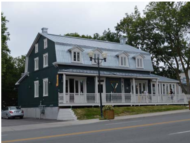
28-30, boulevard Curé-Labelle (Sainte-Rose).