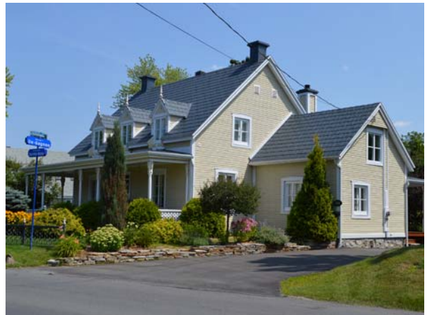
354, boulevard Sainte-Rose (Sainte-Rose).