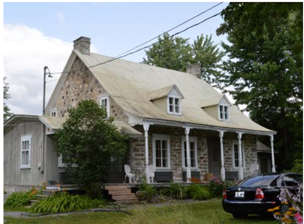
Maison Grenier-Valiquette, 3375, boulevard des Mille-Îles (Saint-François), vers 1835.