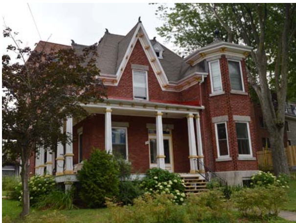
14, rue Cantin (Sainte-Rose).