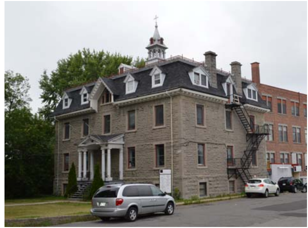
Ancien couvent des Sœurs de Sainte-Croix, 233, boulevard Sainte-Rose (Sainte-Rose).