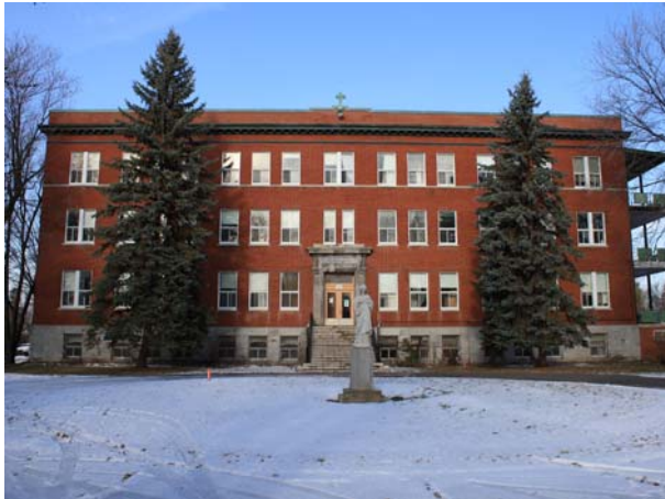
Ancienne maison provinciale des Sœurs de Saint-Cœur-de-Jésus-et-de-Marie, 397, boulevard des Prairies (Laval-des-Rapides).