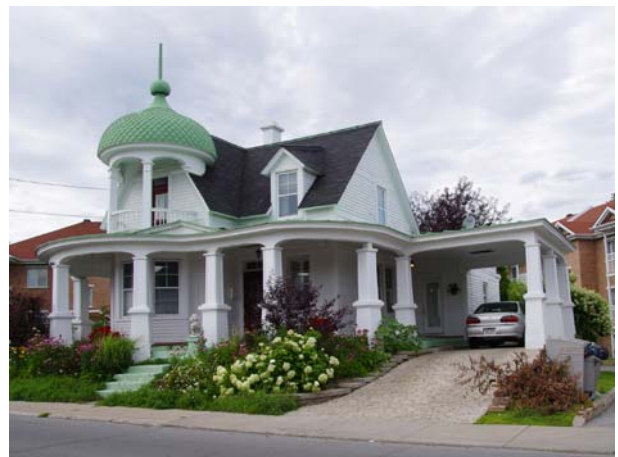
Maison Hotte, 4495, boulevard Lévesque Ouest (Chomedey).