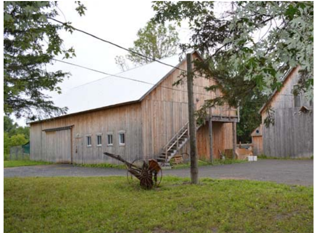
8740, boulevard des Mille-Îles (Saint-François).