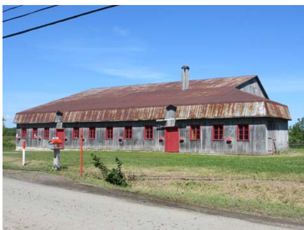
5400, rang du Bas-Saint-François (Duvernay).