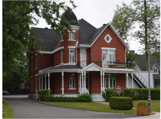
238, boulevard Sainte-Rose (Sainte-Rose).