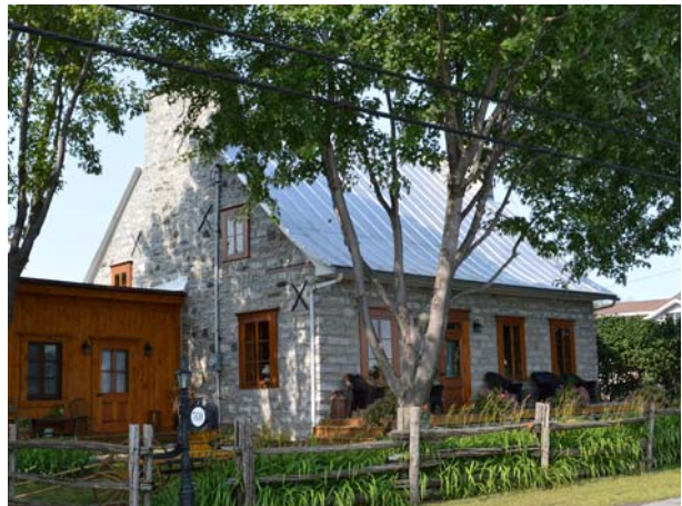
Maison Chartrand, 7630, boulevard des Mille-Îles (Saint-François), vers 1708.