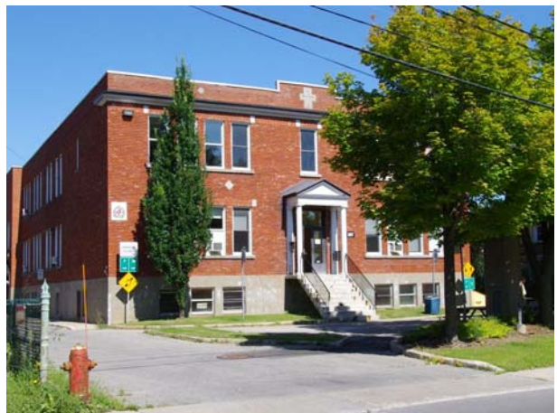
Ancienne école, 387, boulevard des Prairies (Laval-des-Rapides).