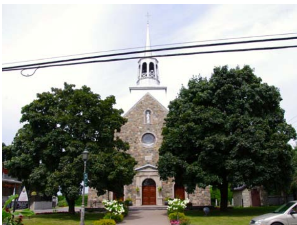
Église de Sainte-Dorothée (1871-1873), 655, rue Principale (Sainte-Dorothée).