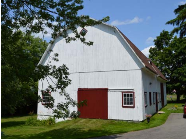
570, boulevard des Mille-Îles (Auteuil).