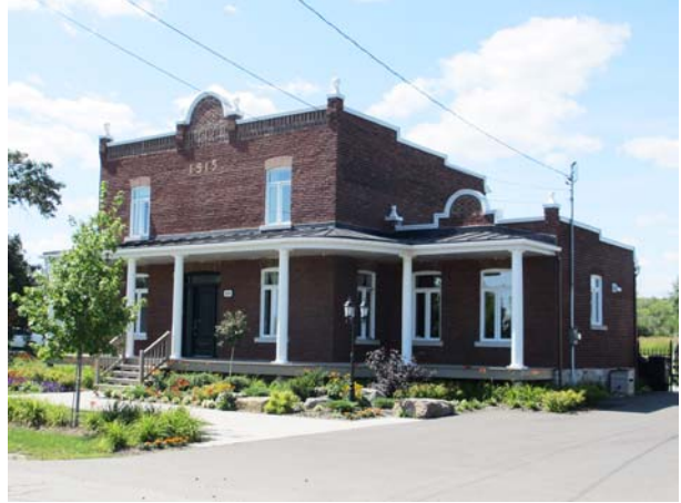
3555, boulevard Saint-Elzéar Est (Duvernay).