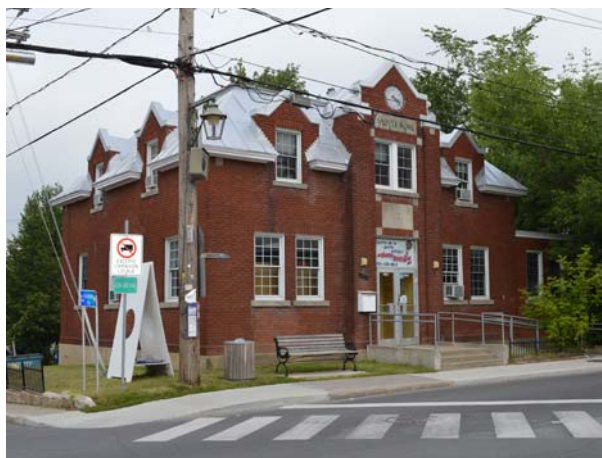
Bureau de poste, 203, boulevard Sainte-Rose (Sainte-Rose).