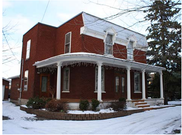
3429, boulevard Saint-Elzéar Ouest (Chomedey).