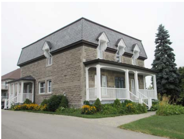
169, boulevard Saint-Martin Ouest (Vimont).