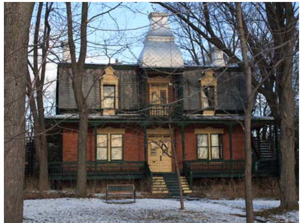
237, boulevard des Prairies (Laval-des-Rapides).