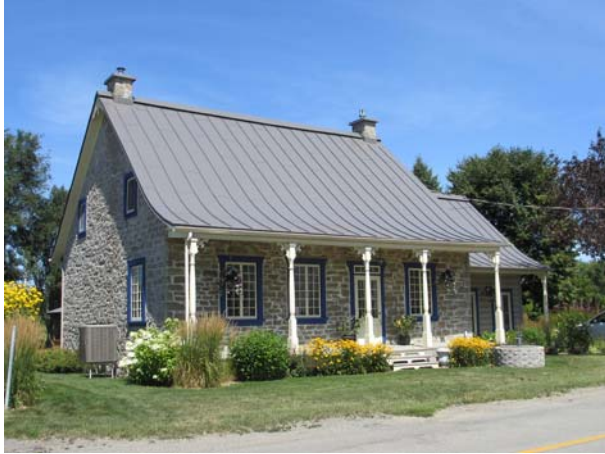
3639, rang du Haut-Saint-François (Duvernay), vers 1858.