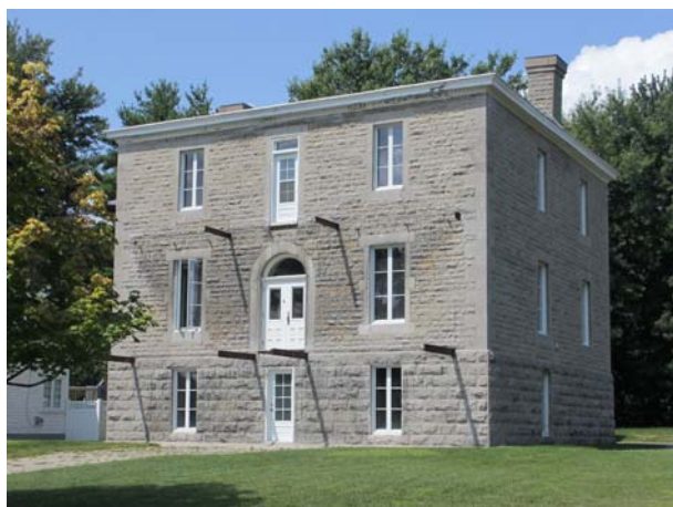
Ancien hôpital Auclair, 371, avenue Bellevue (Saint-Vincent-de-Paul).