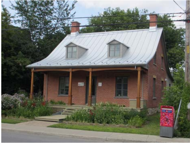
216, boulevard Lévesque Est (Pont-Viau), vers 1853.