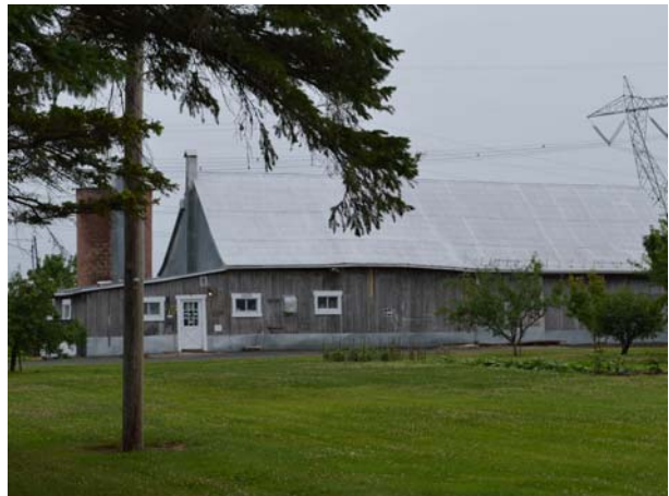
8500, boulevard des Mille-Îles (Saint-François).