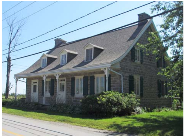
Maison Pierre-Paré, 4730, rang du Haut-Saint-François (Duvernay), vers 1835.