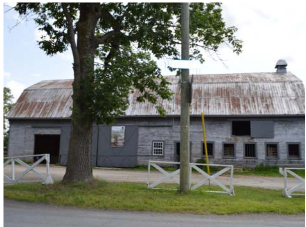
624A, boulevard des Mille-Îles (Auteuil).