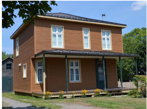
375, boulevard Sainte-Rose (Sainte-Rose). Variante revêtu de bois.