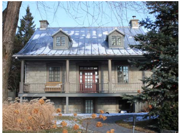
169, boulevard des Prairies (Laval-des-Rapides), vers 1850.