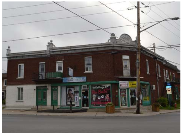
142-146A, boulevard Sainte-Rose (Sainte-Rose). Variante avec commerces au rez-de-chaussée.