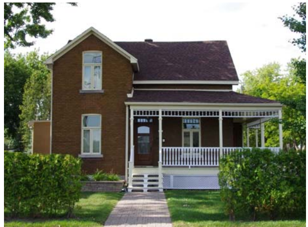
57, boulevard des Prairies (Laval-des-Rapides).