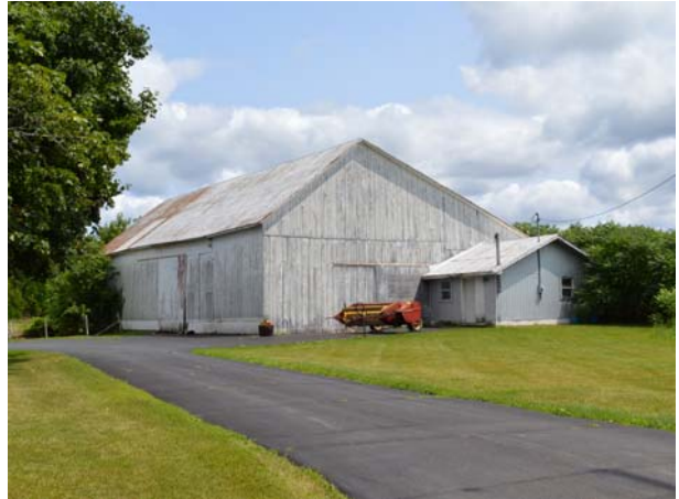
3720, boulevard des Mille-Îles (Saint-François).