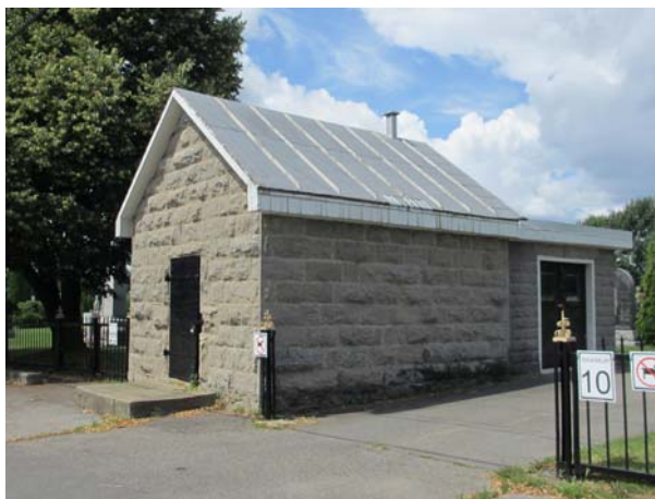
Charnier du cimetière Saint-Vincent-de-Paul, 3503, boulevard Lévesque Est (Saint-Vincent-de-Paul).