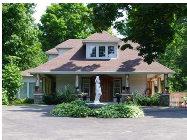
328, rue Les Érables (Laval-sur-le-Lac).