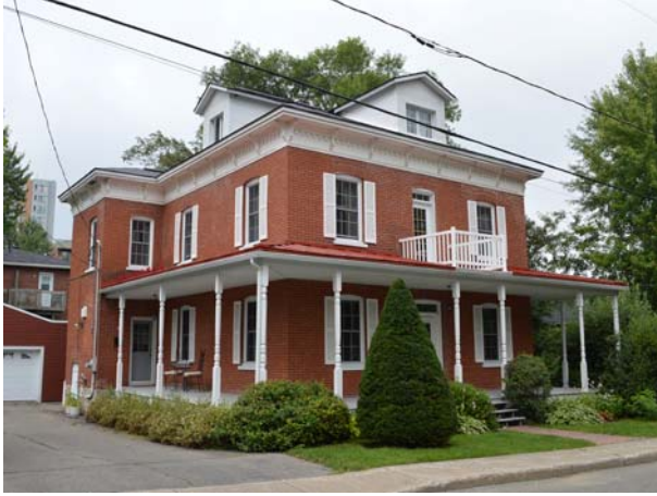
11, rue Cantin (Sainte-Rose).