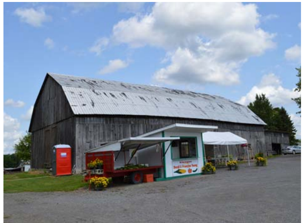
2985, avenue des Perron (Auteuil).