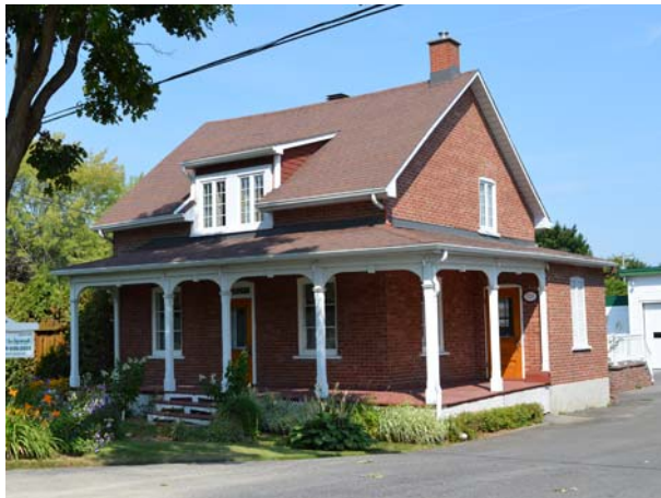
3281, boulevard Dagenais Ouest (Fabreville).