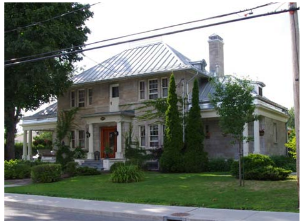
127, boulevard des Prairies (Laval-des-Rapides).