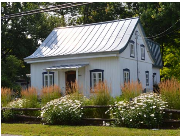
6870, boulevard des Mille-Îles (Saint-François), vers 1866.