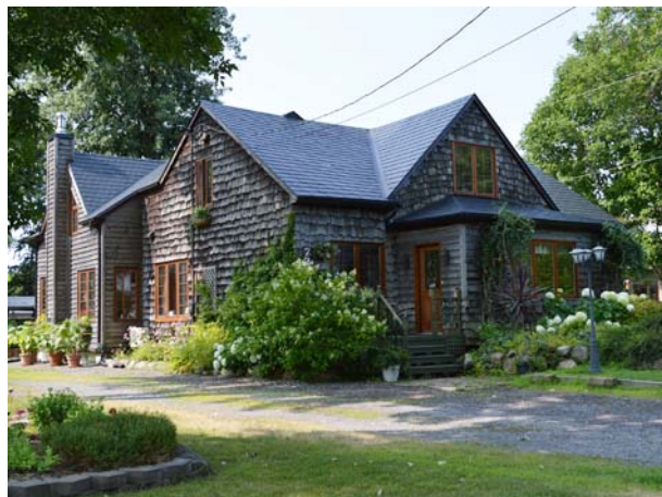
7220, boulevard des Mille-Îles (Saint-François).