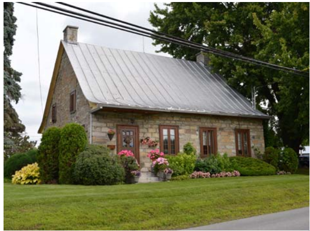
Maison Joly, 99, avenue des Terrasses (Auteuil), vers 1729.