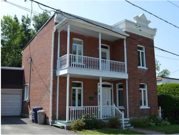
37-39, rue Hotte (Sainte-Rose).