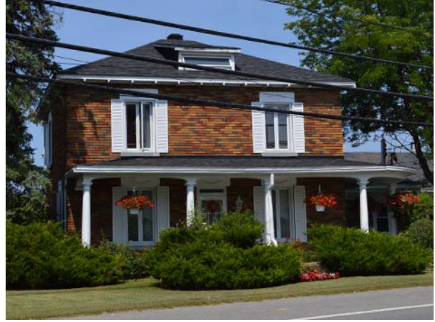
3321, boulevard Sainte-Rose (Fabreville).