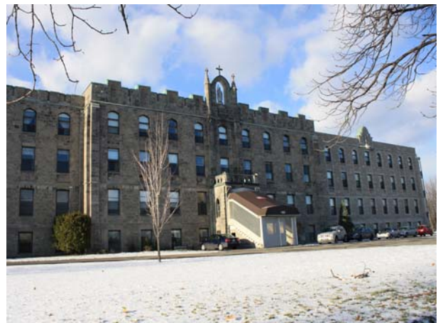
Séminaire des missions étrangères, 180, place Juge-Desnoyers (Pont-Viau).