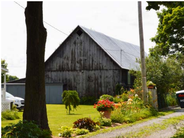
6438, boulevard des Mille-Îles (Saint-François).