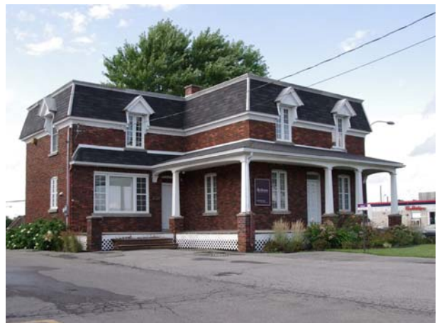
1905, boulevard Saint-Elzéar Ouest (Chomedey).