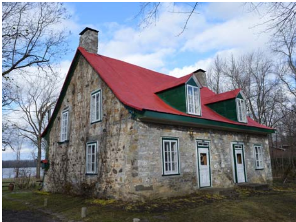
765-775, rue des Patriotes (Sainte-Rose), vers 1740.