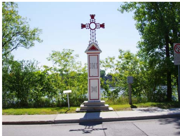
Croix de chemin sur socle, située au 393, boulevard des Prairies (Laval-des-Rapides).