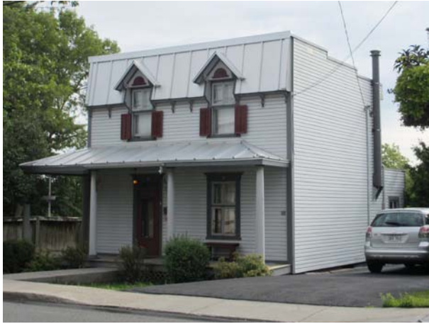
5164, boulevard Lévesque Est (Saint-Vincent-de-Paul).