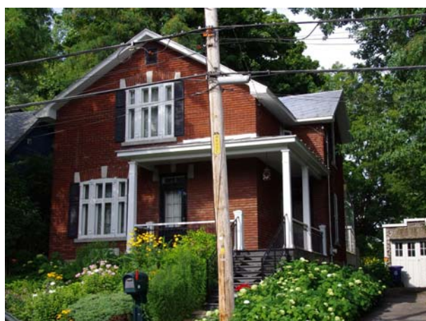
25, avenue du Parc (Laval-des-Rapides).