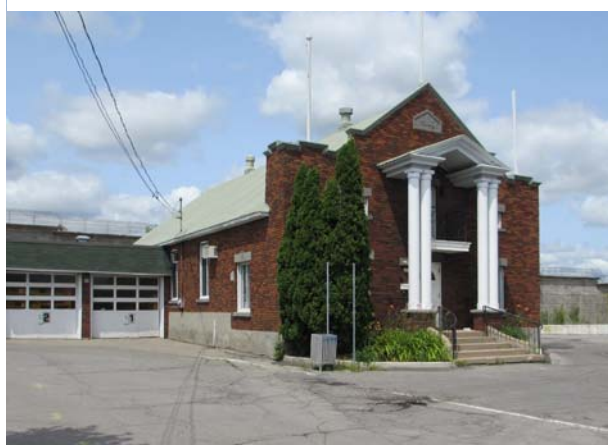
Édifice ayant servi d'hôtel de ville et de poste d'incendie, 1111, place J.-Eudes-Blanchard (Saint-Vincent-de-Paul).