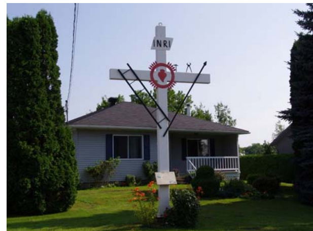
Croix Barbe ornée du Sacré-Cœur et d'instruments de la passion. 418, rang Saint-Antoine (Sainte-Dorothée).