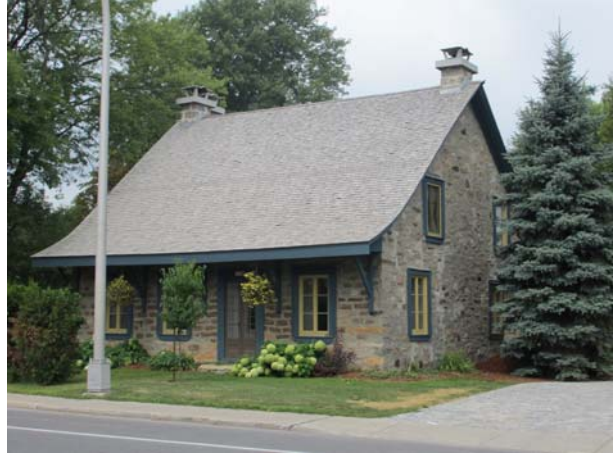
208, boulevard Sainte-Rose Est (Vimont), vers 1800.