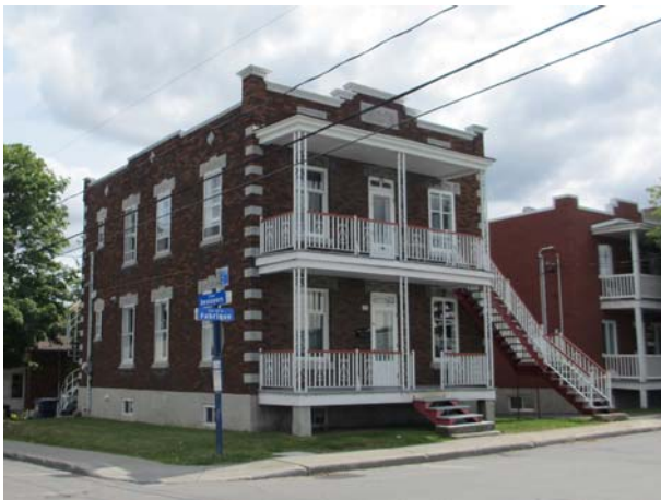
4944-4946, rue de la Fabrique (Saint-Vincent-de-Paul).