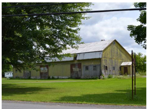
3490, boulevard des Mille-Îles (Saint-François).