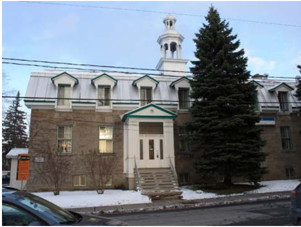
Ancien couvent des Sœurs de Sainte-Croix, 1665-1675, rue du Couvent (Chomedey).