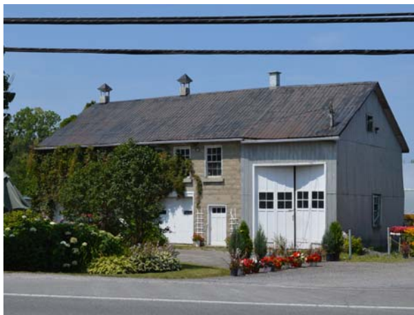
Ancien bâtiment agricole, probablement un poulailler reconnaissable à ses nombreuses ouvertures, 3321, boulevard Sainte-Rose (Fabreville).