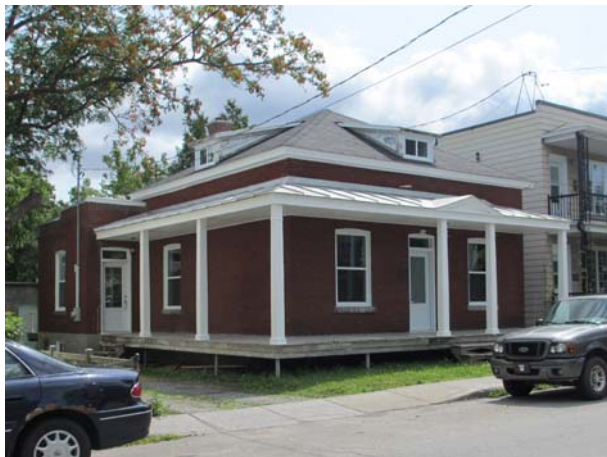
5206, rue de la Fabrique (Saint-Vincent-de-Paul). Variante à un seul étage.