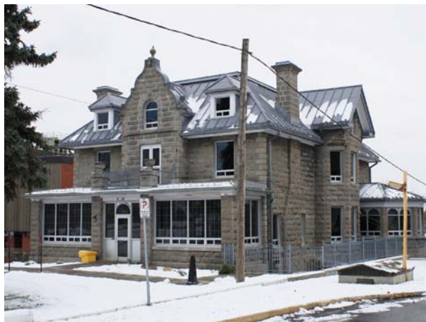
5486, boulevard Lévesque Est (Saint-Vincent-de-Paul).