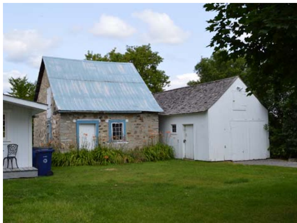
Anciens hangars, 4675, boulevard des Mille-Îles (Saint-François).