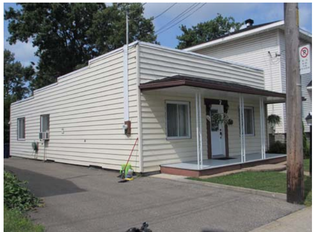
36, rue Jubinville (Pont-Viau).