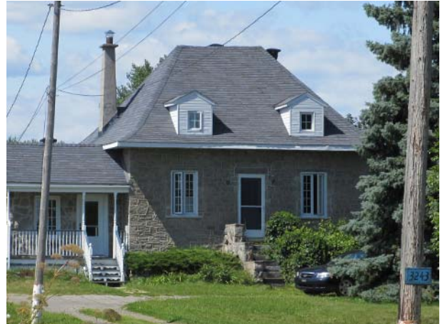
3243, boulevard Saint-Elzéar Est (Duvernay).