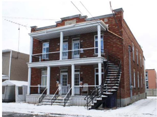
5190-5196, rue de la Fabrique (Saint-Vincent-de-Paul).