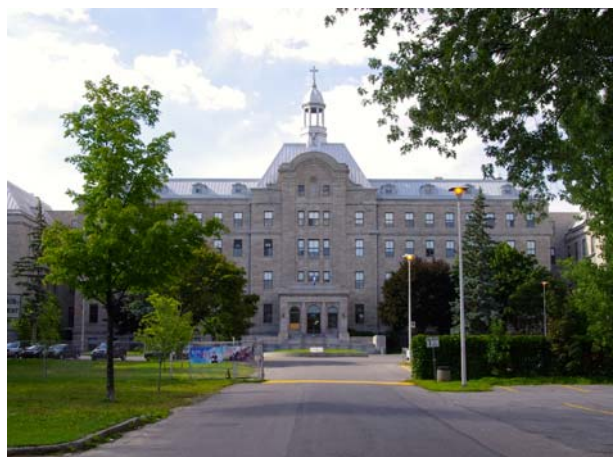
Ancien pensionnat Mont-De La Salle, devenu école secondaire, 125, boulevard des Prairies (Laval-des-Rapides).