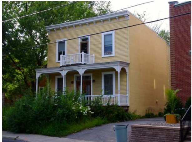
243-245, boulevard des Prairies (Laval-des-Rapides).