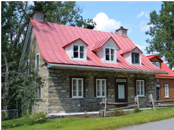
537, boulevard des Mille-Îles (Auteuil), vers 1800.