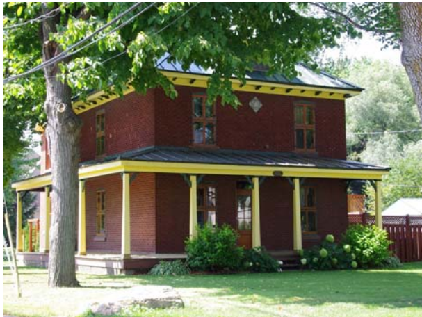
602-604, chemin du Bord-de-l'Eau (Sainte-Dorothée).