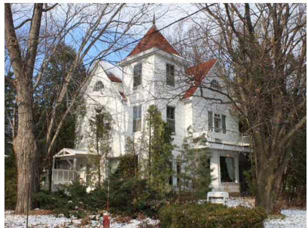
467, avenue Bellevue (Saint-Vincent-de-Paul).