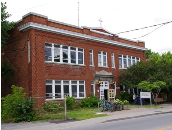
Ancienne école, 3781, boulevard Lévesque Ouest (Chomedey).