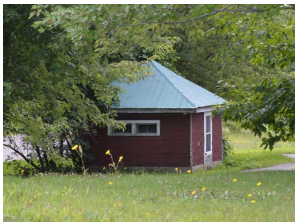
Ancienne laiterie, 4500, avenue des Perron (Auteuil).