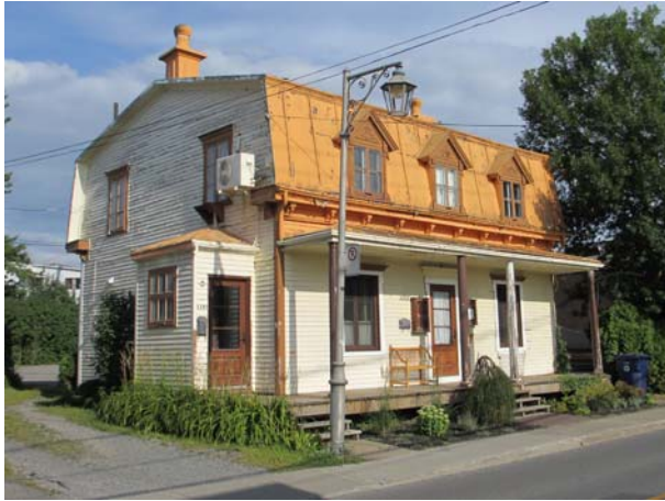
5301-5303, boulevard Lévesque Est (Saint-Vincent-de-Paul).