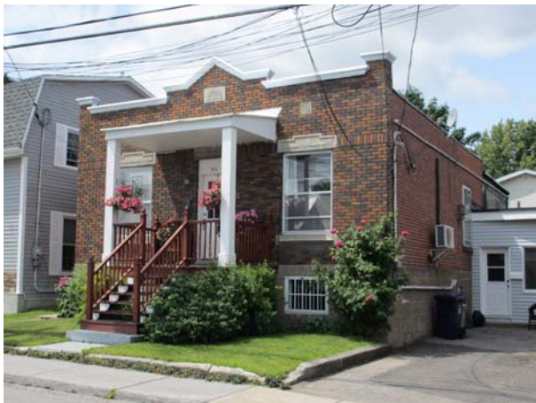
5313, rue de la Fabrique (Saint-Vincent-de-Paul).