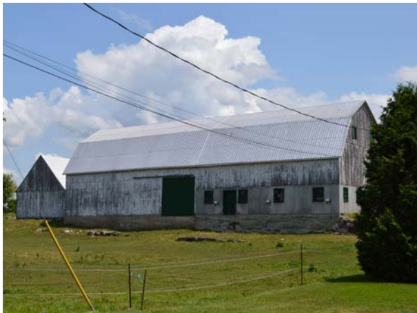
574, boulevard des Mille-Îles (Auteuil).