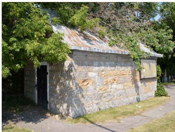
Charnier funéraire, 1860, rue des Patriotes (Sainte-Rose).