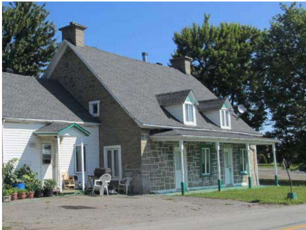
5805, rang du Bas-Saint-François (Duvernay), vers 1870.