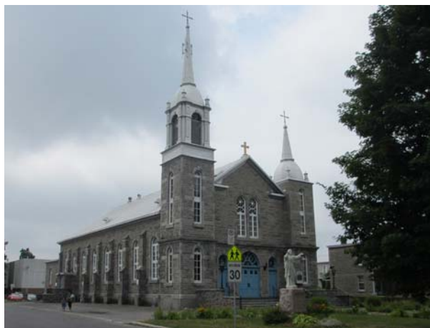
Église de Saint-Elzéar (1917-1919), 16A, boulevard Saint-Elzéar Est (Vimont).