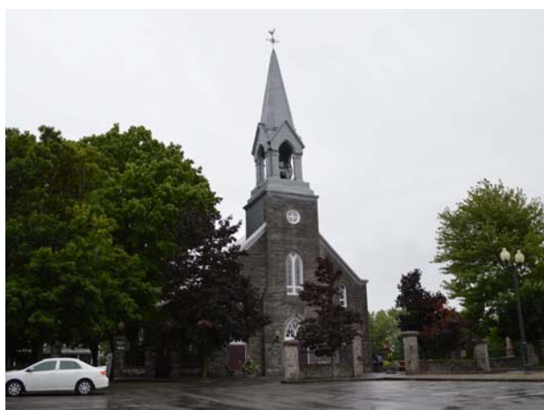
Église de Saint-François-de-Sales (1846-1847), 7070, boulevard des Mille-Îles (Saint-François).