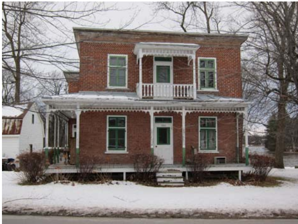
795, boulevard des Mille-Îles (Auteuil).