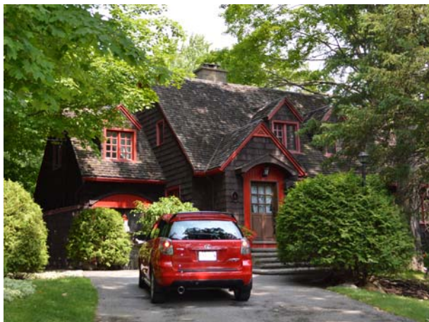
4, rue de la Montagne (Sainte-Rose).