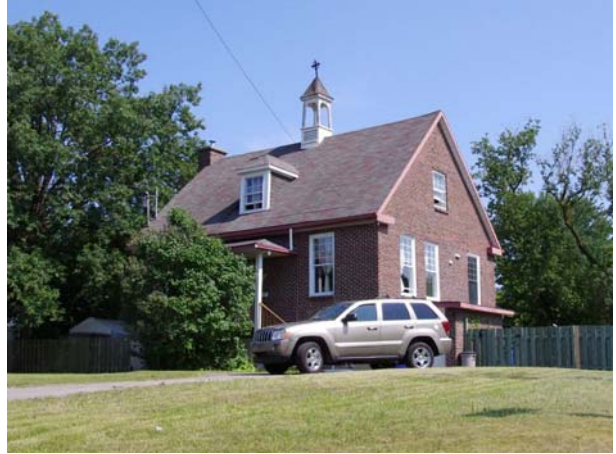
Ancienne école de rang (maison Dutrisac), 5000-5002, boulevard Sainte-Rose (Laval-Ouest).