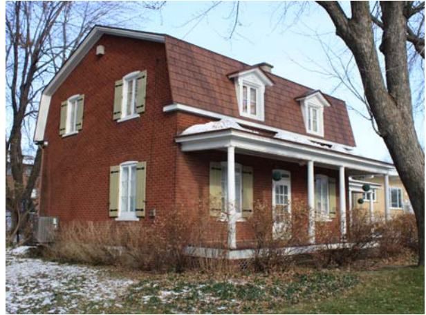
4997, boulevard Lévesque Ouest (Chomedey).