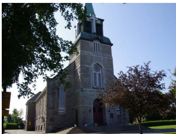
Église de Saint-Martin (1949-1950), 4084, boulevard Saint-Martin Ouest (Chomedey).