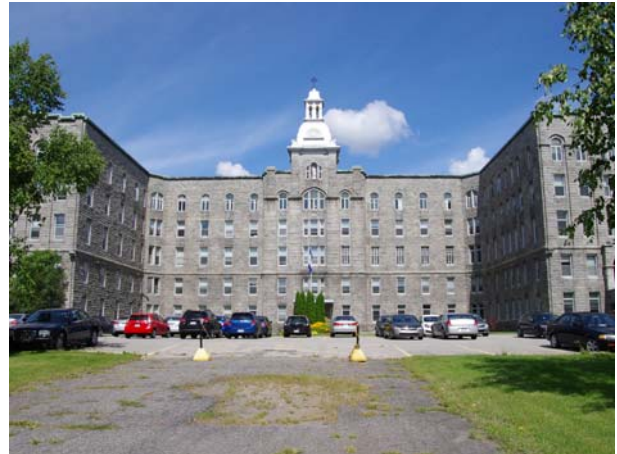
Ancienne maison Sainte-Domitille des Sœurs de Notre-Dame du Bon-Pasteur d'Angers, 235, boulevard des Prairies (Laval-des-Rapides).