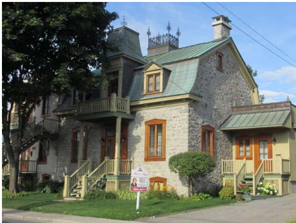
5367-5369, boulevard Lévesque Est (Saint-Vincent-de-Paul).