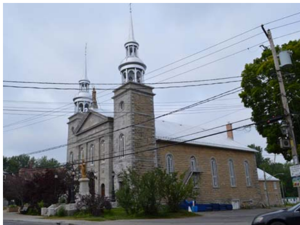
Église de Sainte-Rose-de-Lima (1856), 219, boulevard Sainte-Rose (Sainte-Rose).