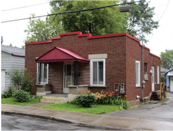
73, rue Lahaie (Pont-Viau).