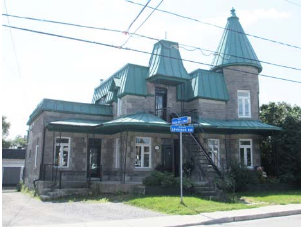
4168, boulevard Lévesque Est (Saint-Vincent-de-Paul).