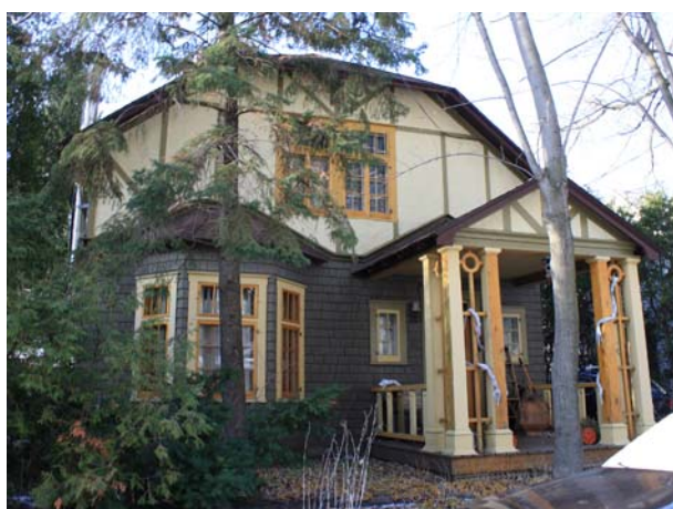
48, 66 e Avenue (Chomedey).