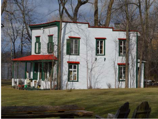
755, rue des Patriotes (Sainte-Rose).