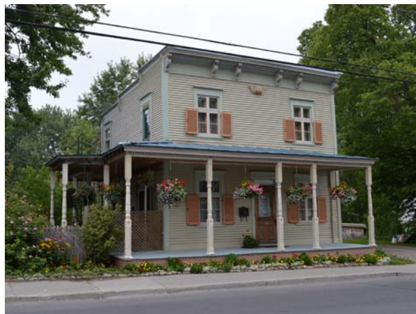
113, boulevard Sainte-Rose (Sainte-Rose).