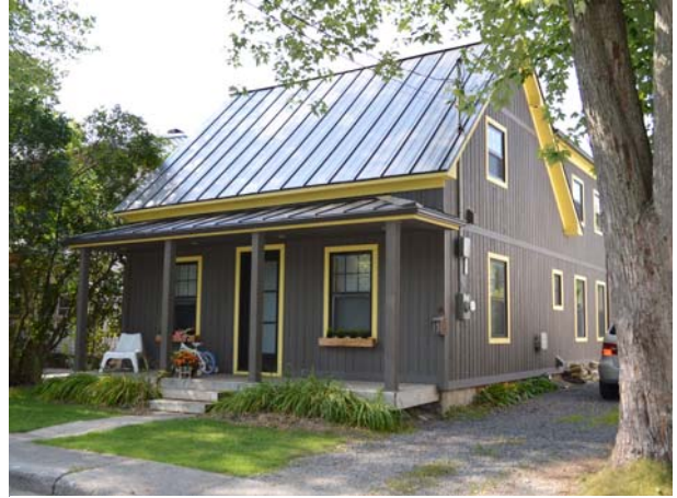
13, rue Blondin (Sainte-Rose).