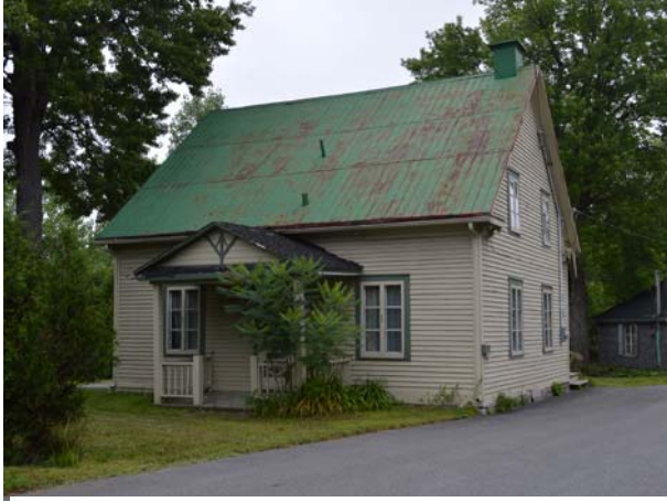
60, boulevard Sainte-Rose (Sainte-Rose).