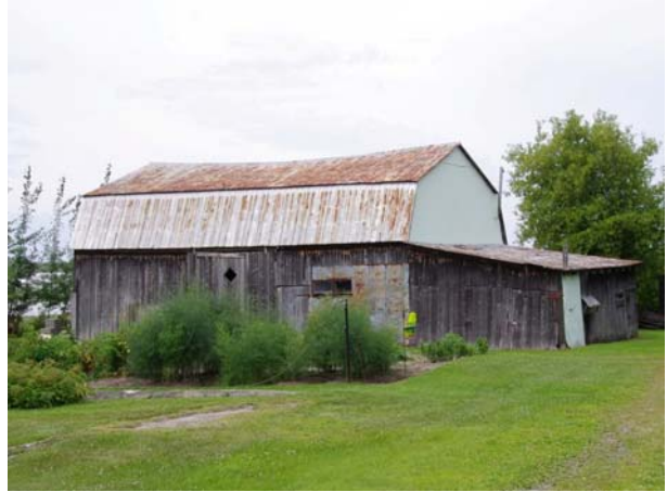
725, rue Principale (Sainte-Dorothée).