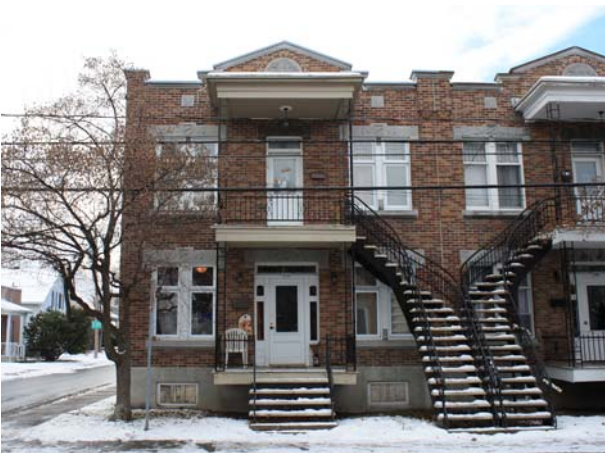
1038-1040, avenue Deslauriers (Saint-Vincent-de-Paul).