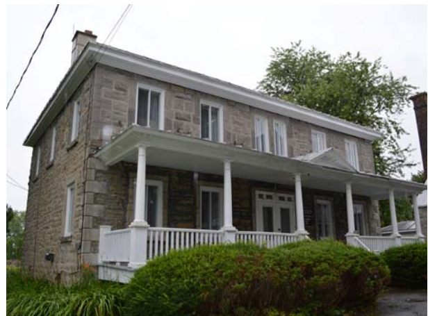
Presbytère de Saint-François-de-Sales, 7070, boulevard des Mille-Îles (Saint-François).