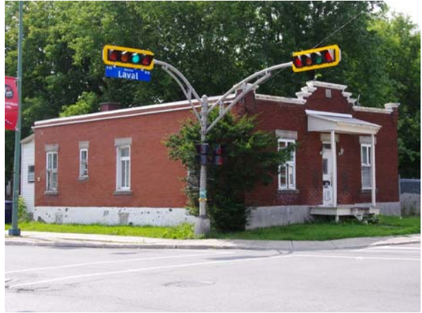
126, avenue Laval (Laval-des-Rapides).