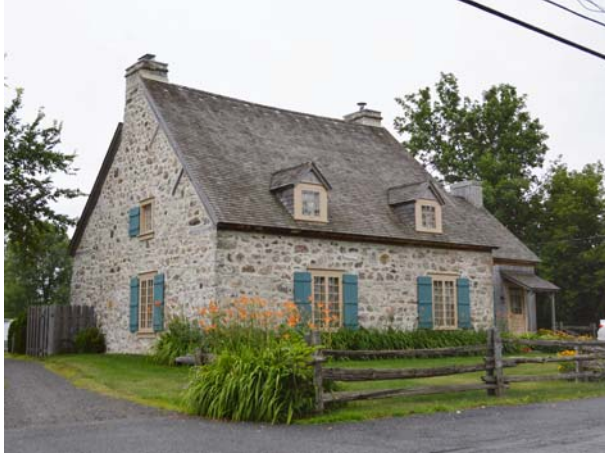
Maison Therrien, 9770, boulevard des Mille-Îles (Saint-François), vers 1680.