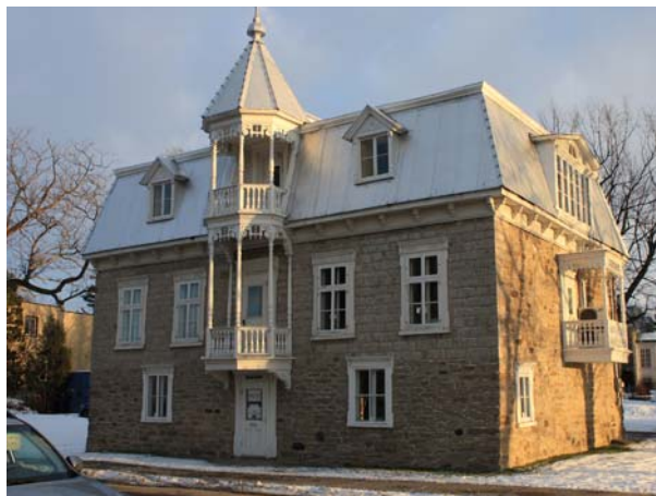
Maison Papineau-Cléroux qui a déjà abrité un magasin et une étude notariale, 4040, boulevard Saint-Martin Ouest (Chomedey).