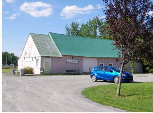
5475, boulevard Saint-Martin Ouest (Chomedey).