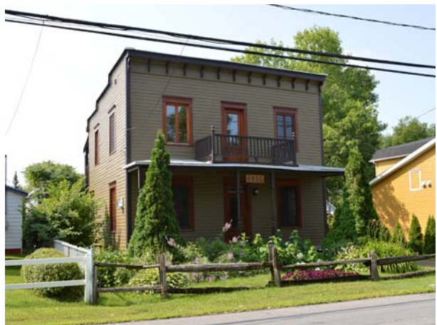
6930, boulevard des Mille-Îles (Saint-François).