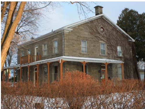
Presbytère de Saint-Martin, 4080, boulevard Saint-Martin Ouest (Chomedey).