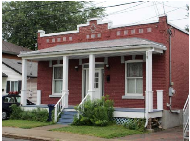
129, rue Saint-Hubert (Pont-Viau).