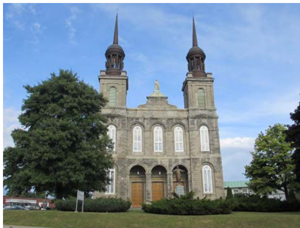
Église de Saint-Vincent-de-Paul (1853-1855), 5443, boulevard Lévesque Est (Saint-Vincent-de-Paul).