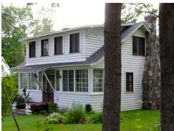
2, rue Islemere (Sainte-Dorothée).