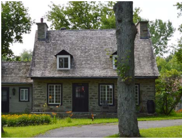
4800, avenue des Perron (Auteuil), vers 1800.