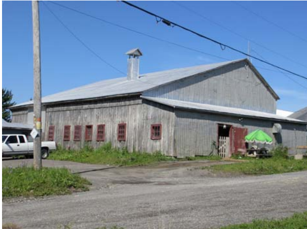
5795, rang du Bas-Saint-François (Duvernay).