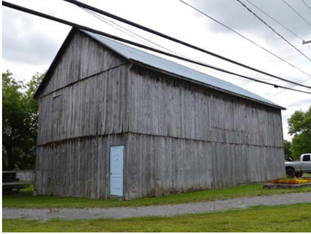
4700, boulevard des Mille-Îles (Saint-François).