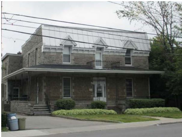
Presbytère de Saint-Elzéar, 16, boulevard Saint-Elzéar Est (Vimont).