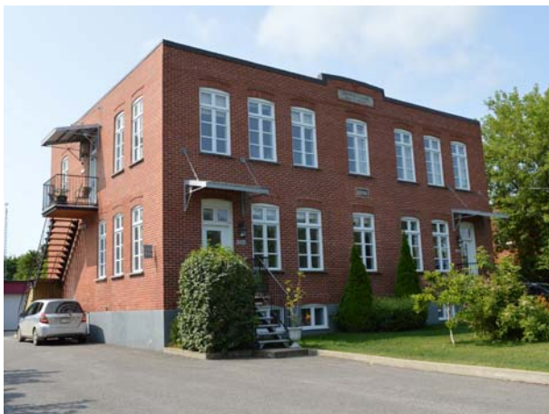
Ancienne école Saint-François, 6990-6992, boulevard des Mille-Îles (Saint-François).