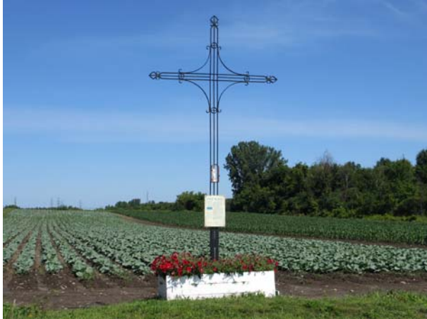
Croix Deguire en métal, 5650, rang du Bas-Saint-François (Duvernay).