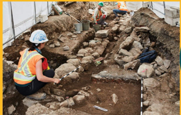
Une partie des vestiges d'un ancien hôtel mis au jour par les archéologues.

👉 laval.ca , sous l'onglet Citoyens/Urbanisme/Haltes estivales