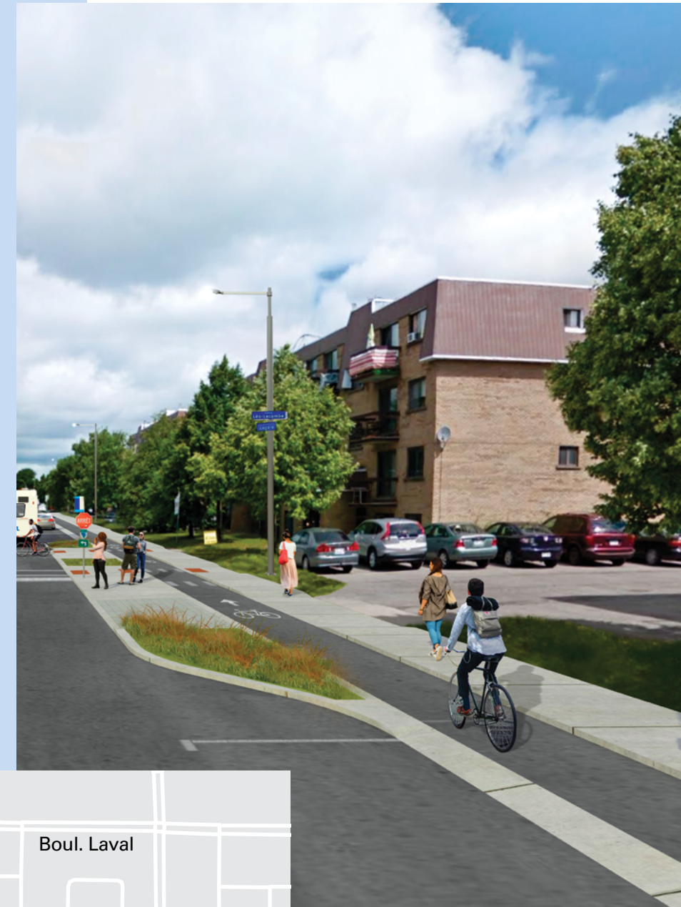
Ajout de saillies végétalisées aux intersections de l'avenue Ampère

Ces travaux entraîneront des modifications dans la configuration des cases de stationnement sur l'avenue Ampère ainsi que le retrait des cases aménagées à même l'emprise publique de la Ville.