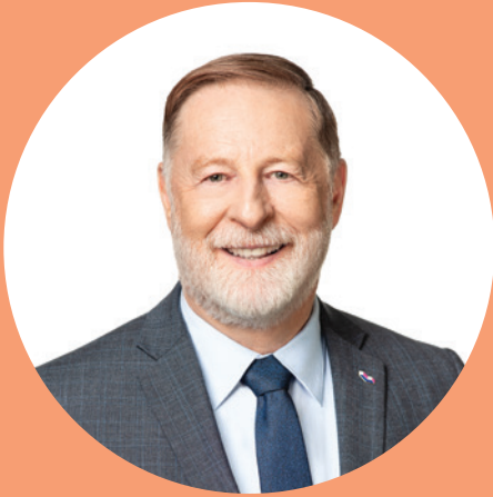
Marc Demers Maire de Laval