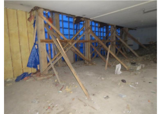
Mur porteur temporaire