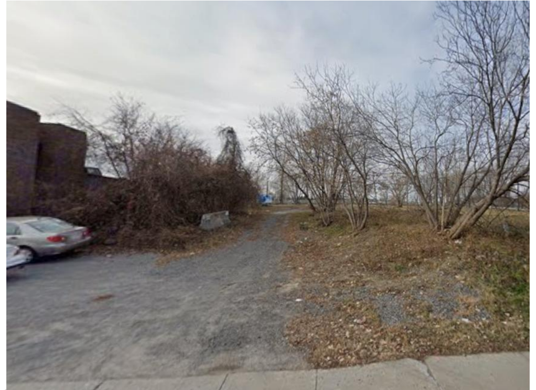
Terrain vacant à droite