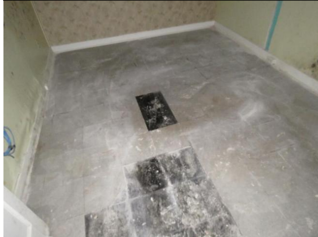
Revêtement de plancher