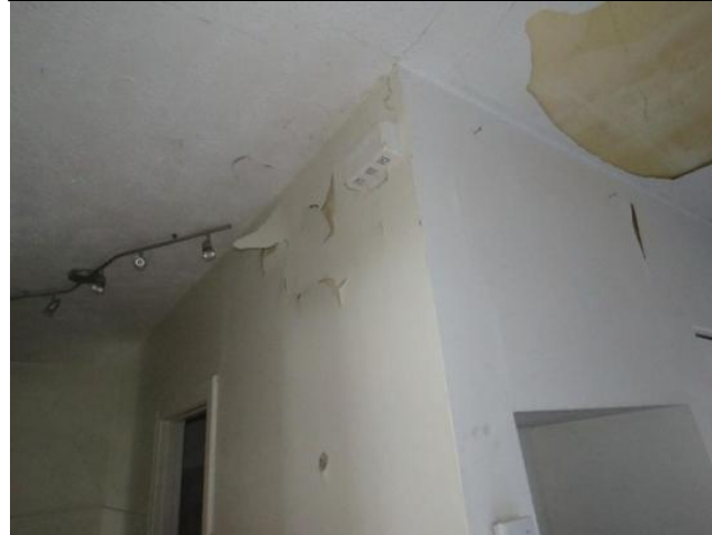
Murs et plafond