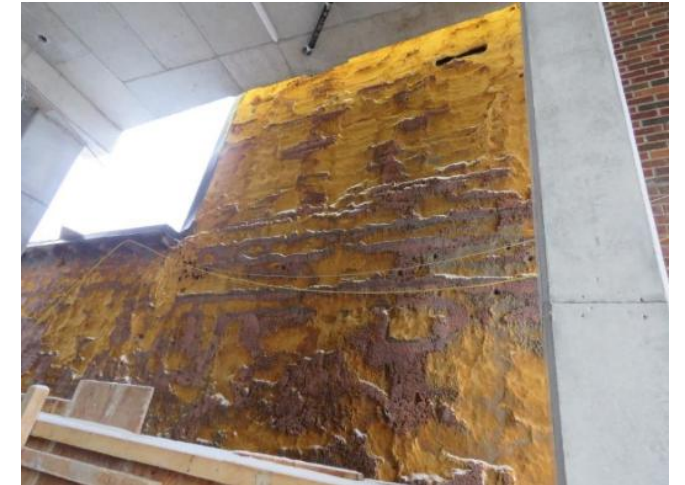
Mur latéral gauche