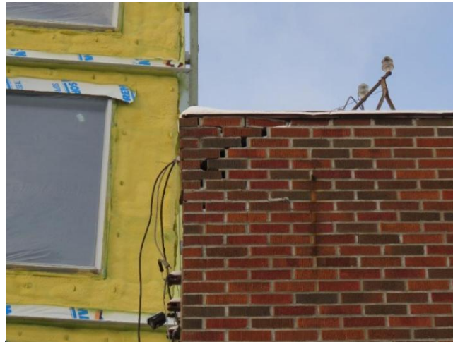
Revêtement de brique