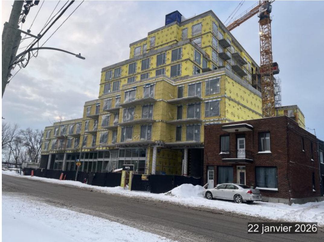
Bâtiment en construction à gauche