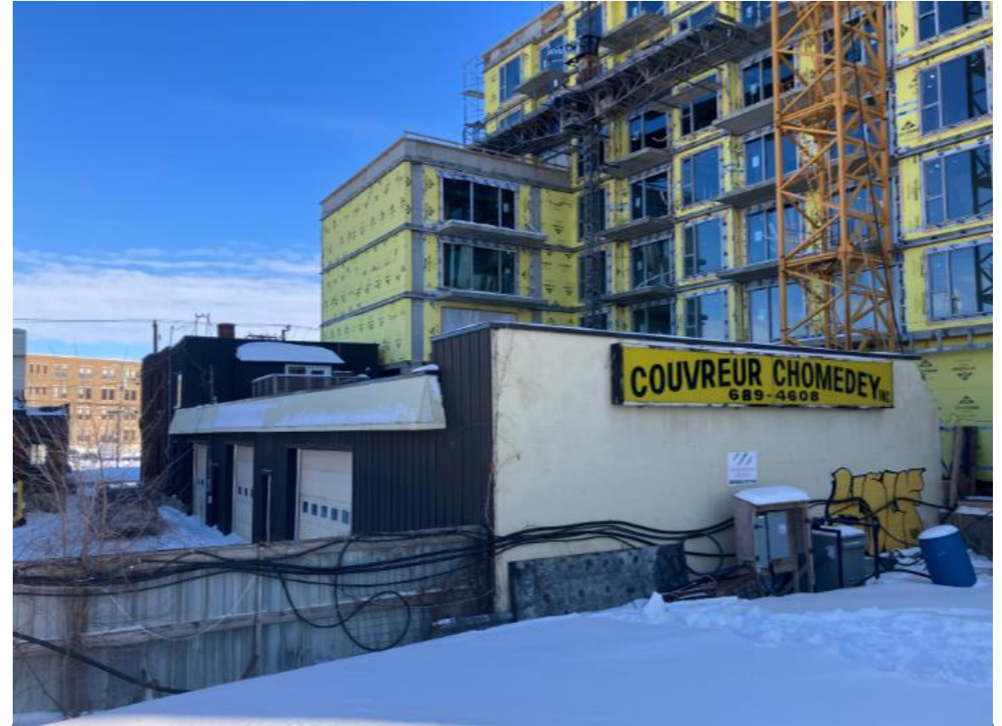
Façades arrière et latérale droite