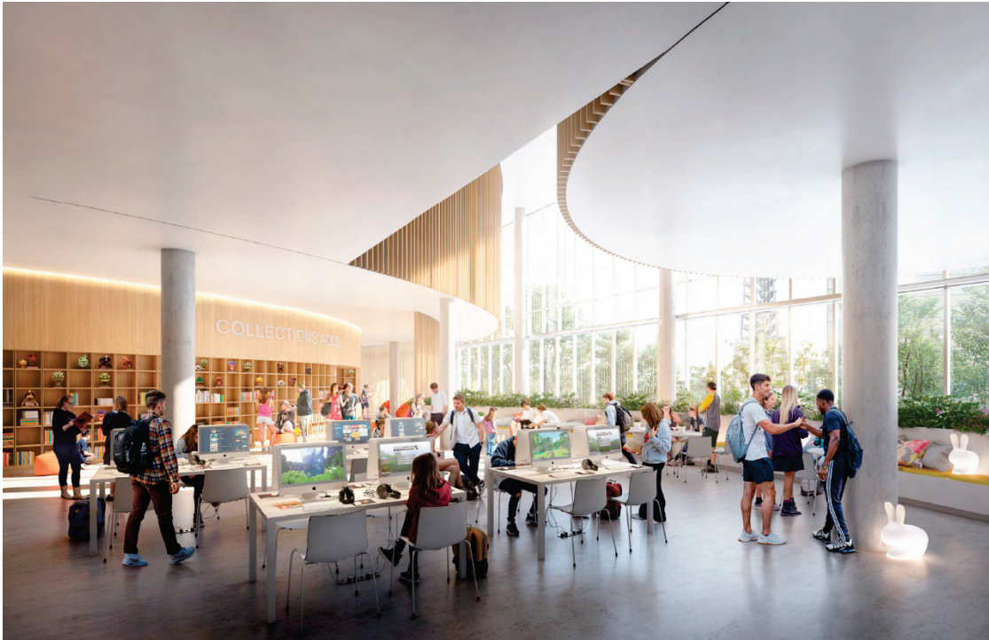
Image 8 – Bibliothèque centrale Anne-Marie-Alonzo – Collections ados – 2 e étage