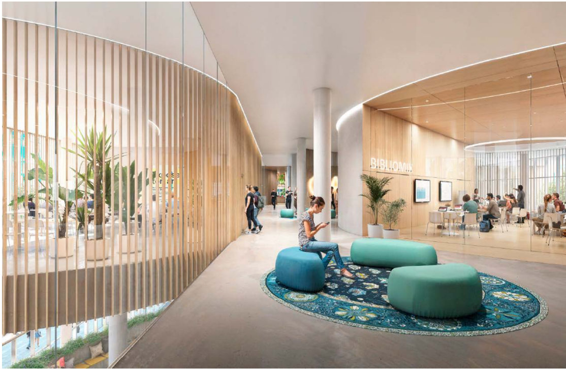
Image 10 – Bibliothèque centrale Anne-Marie-Alonzo – Collections littéraires – 3 e étage