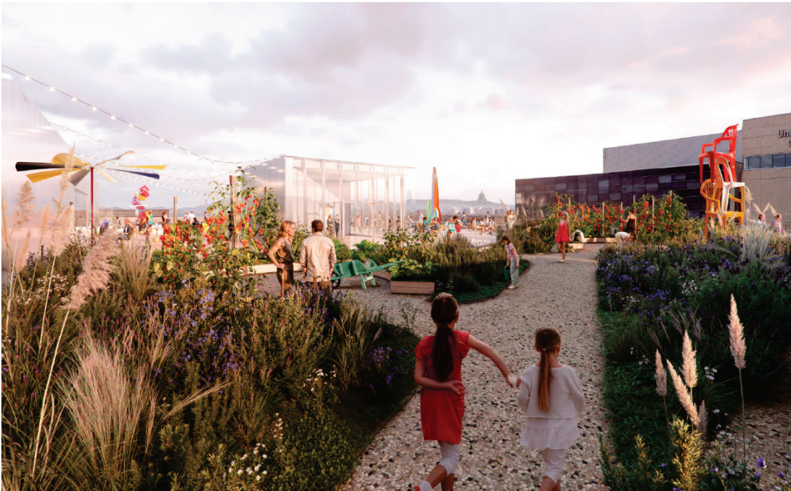
Image 11 – Épicentre-Culturel – Toiture végétalisée et accessible – 5 e étage