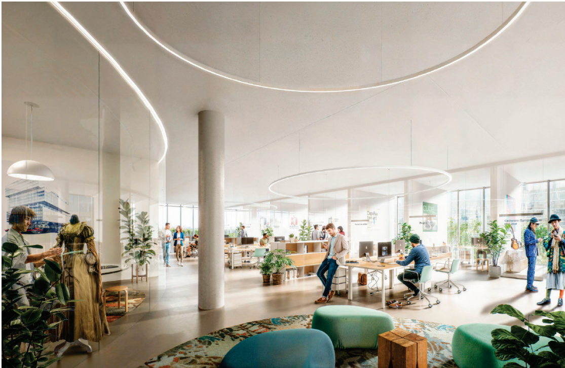
Image 9 – Centre de création artistique professionnelle Lysane-Gendron – ateliers et studios – 4 e étage