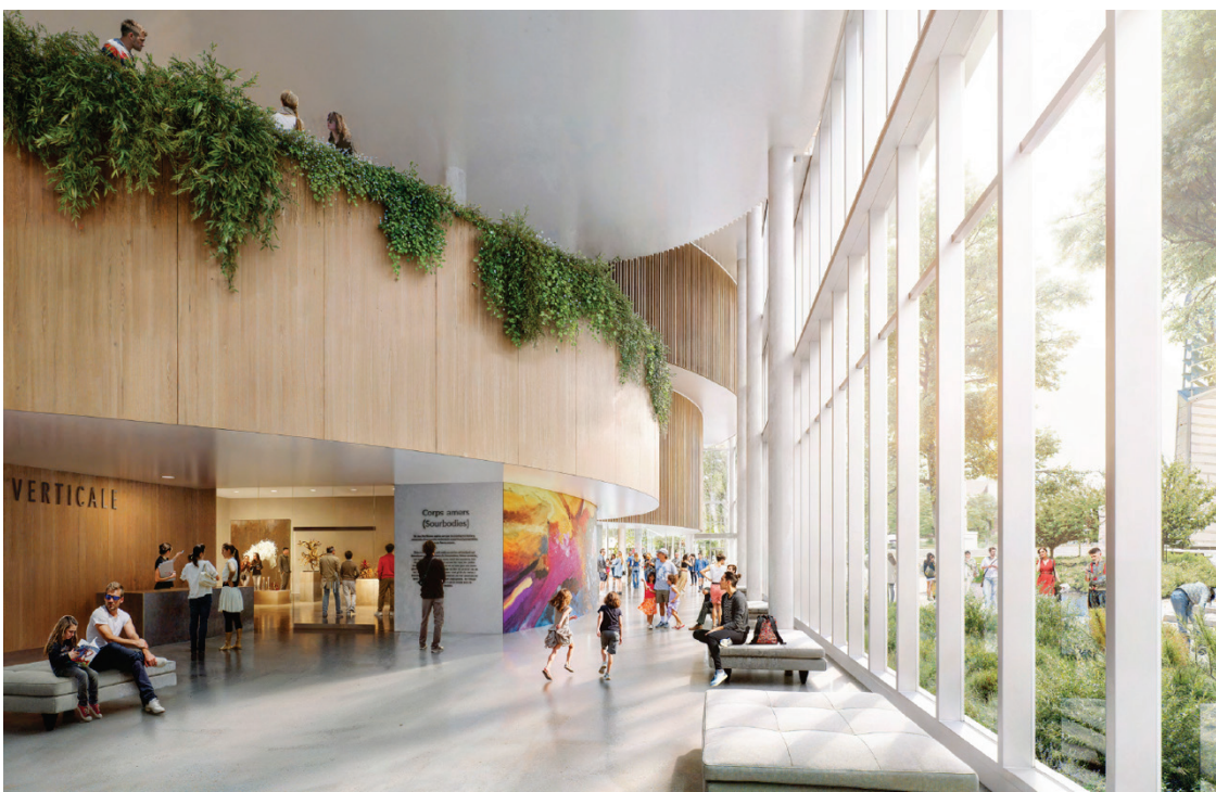
Image 7 – Épicentre-Culturel – Centre de création artistique professionnelle Lysane-Gendron – rez-de-chaussée