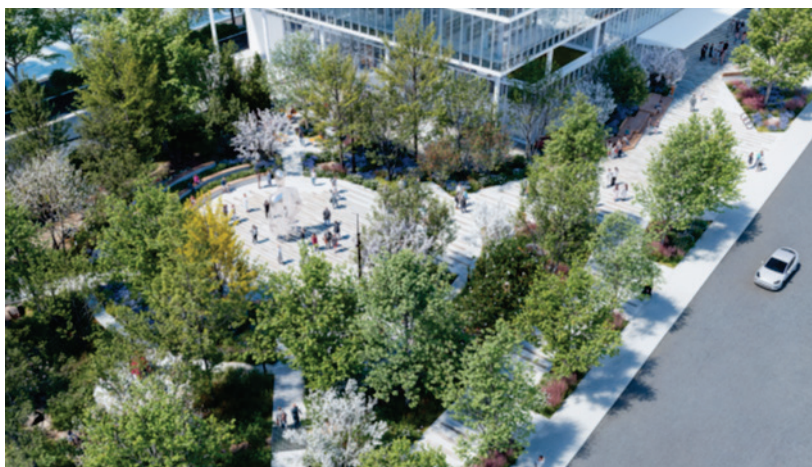
Image 4 – Concept d'aménagement – Projet paysage en collaboration Montoni – Atelier TAG & NEUF

Le concept d'aménagement reprend le vocabulaire développé pour le programme architectural. Délimitée par des tambours extérieurs au pavage distinctif, l'agora, empreinte de nature, est propice à la détente, à la contemplation et aux interactions sociales, en plus de permettre le déploiement d'une offre culturelle hors les murs.