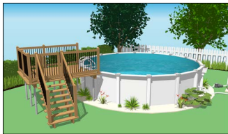
Piscine hors terre avec plateforme munie d'une enceinte de protection.