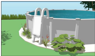
Piscine hors terre avec échelle munie d'une portière de sécurité qui se referme et se verrouille automatiquement.