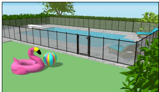
Piscine creusée complètement clôturée.