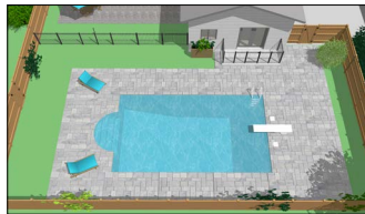
Piscine creusée clôturée avec balcon muni d'une enceinte de protection.