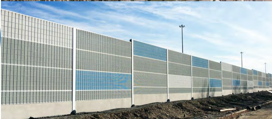
Autoroute 15 | Rue Guillemette