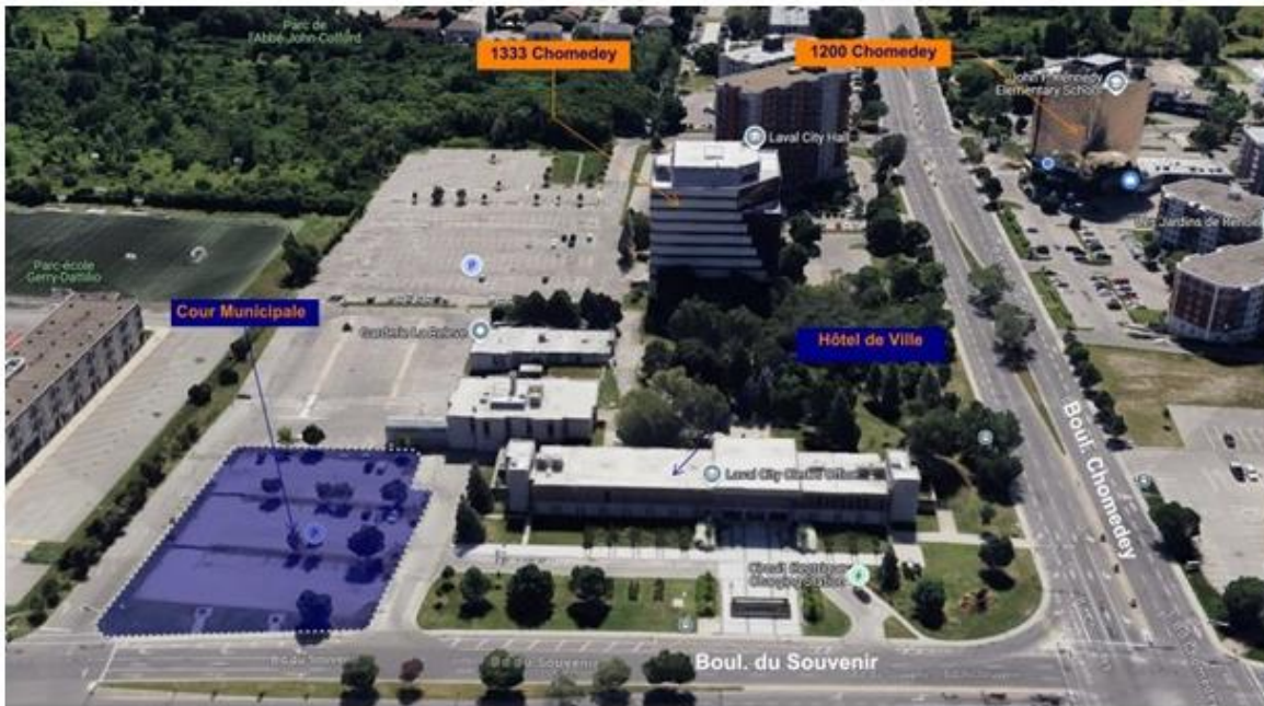
Image 2 – Localisation de la cour municipale dans le quartier Chomedey

Ainsi, la cour municipale gère les constats d’infraction dès leur réception jusqu’à l’exécution du jugement. De plus, depuis le 1 er février 2020, la cour municipale de Laval exerce la juridiction de la Partie XXVII du Code criminel, qui comporte notamment (mais non exclusivement) certaines infractions contre l’ordre public, des infractions d’ordre sexuel et d’inconduite, des infractions contre la personne et la réputation, certaines opérations frauduleuses en matière de contrats et de commerce et aux droits de propriété.