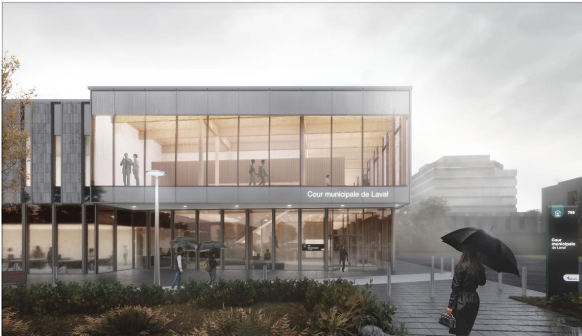
Image 6 – Vue du parvis, et de l'entrée principale de la cour municipale.