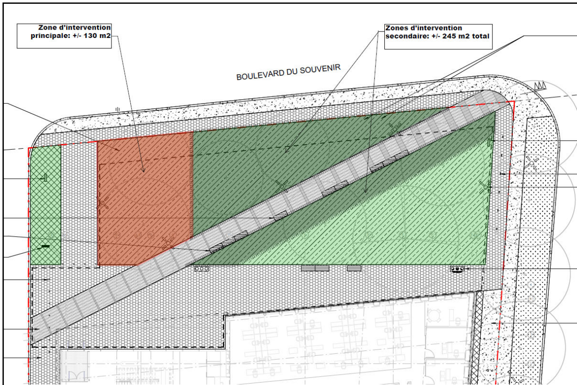
Image 4 – Zones d’implantation de l’œuvre. ▨ Intervention principale ▨ éléments secondaire(s)

L’œuvre sera baignée par la lumière naturelle le jour, mais devra être éclairée le soir venu. L’artiste devra donc intégrer une stratégie d’éclairage qui met en valeur sa proposition . L’œuvre doit pouvoir être appréciée en tout temps et en toute saison 7 .