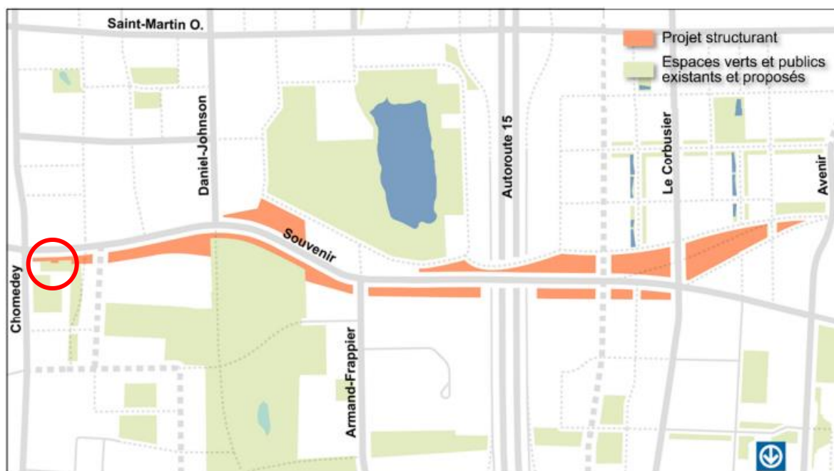
Image 13 – À gauche, le cercle rouge représente le positionnement de la cour municipale et du pôle civique. En orange, le tracé du parc linéaire du Souvenir.