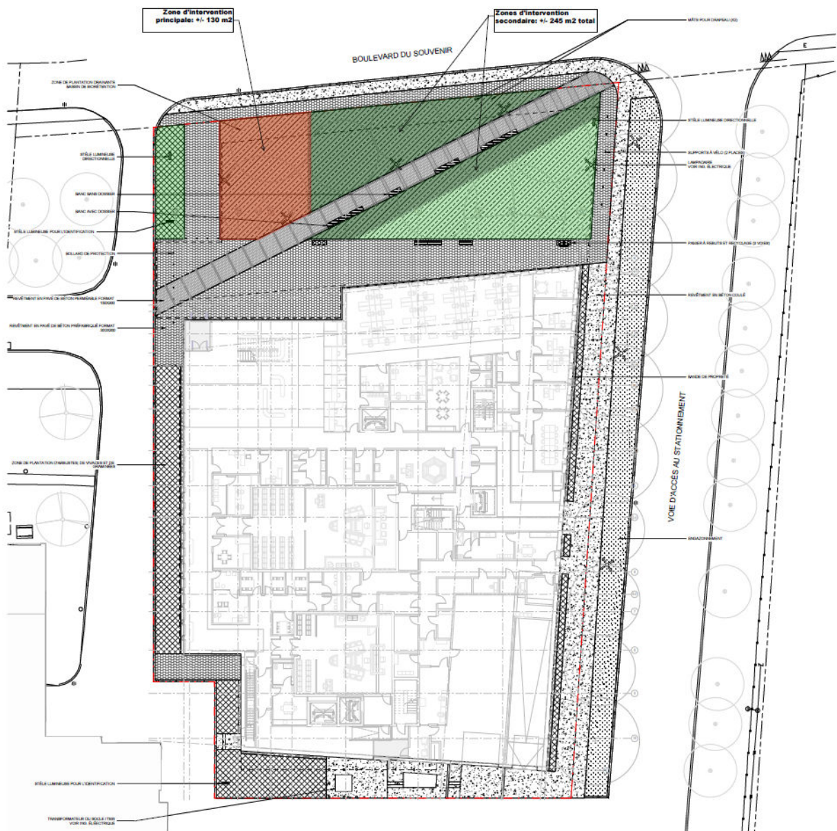
Image 5 – Plan et zones d’implantation de l’œuvre d’art public sur le parvis.