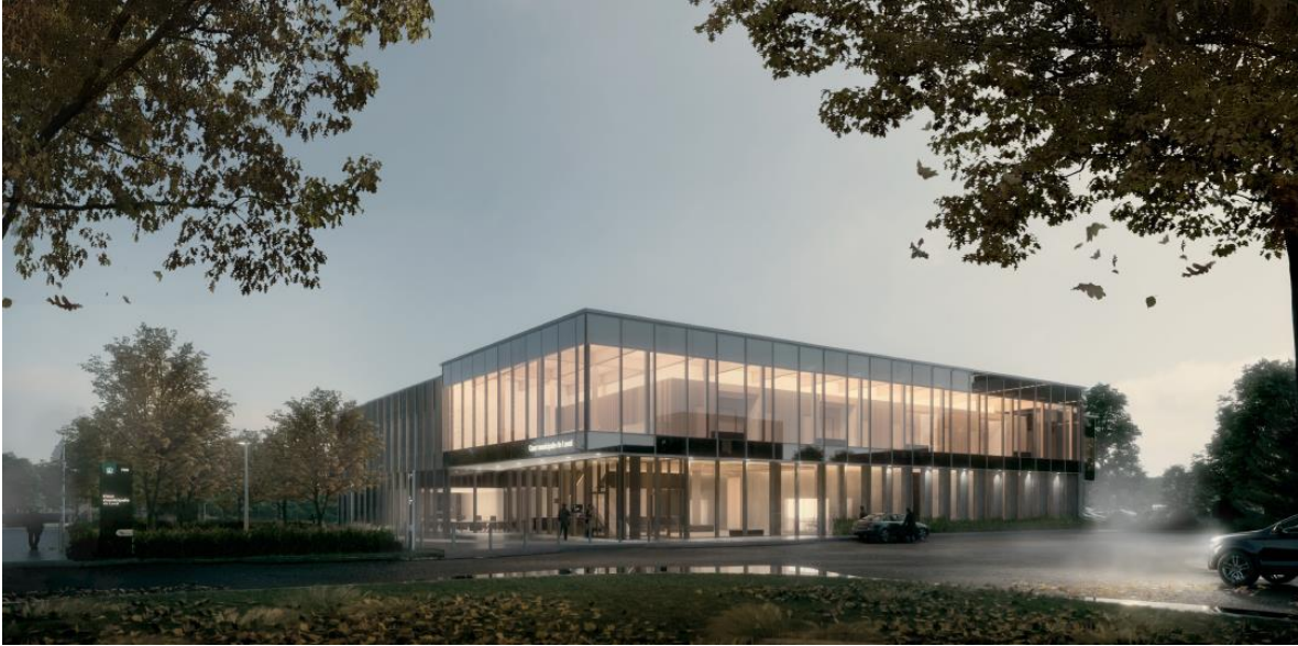
Image 8 – Vue des façades nord et ouest de la cour municipale, en automne.