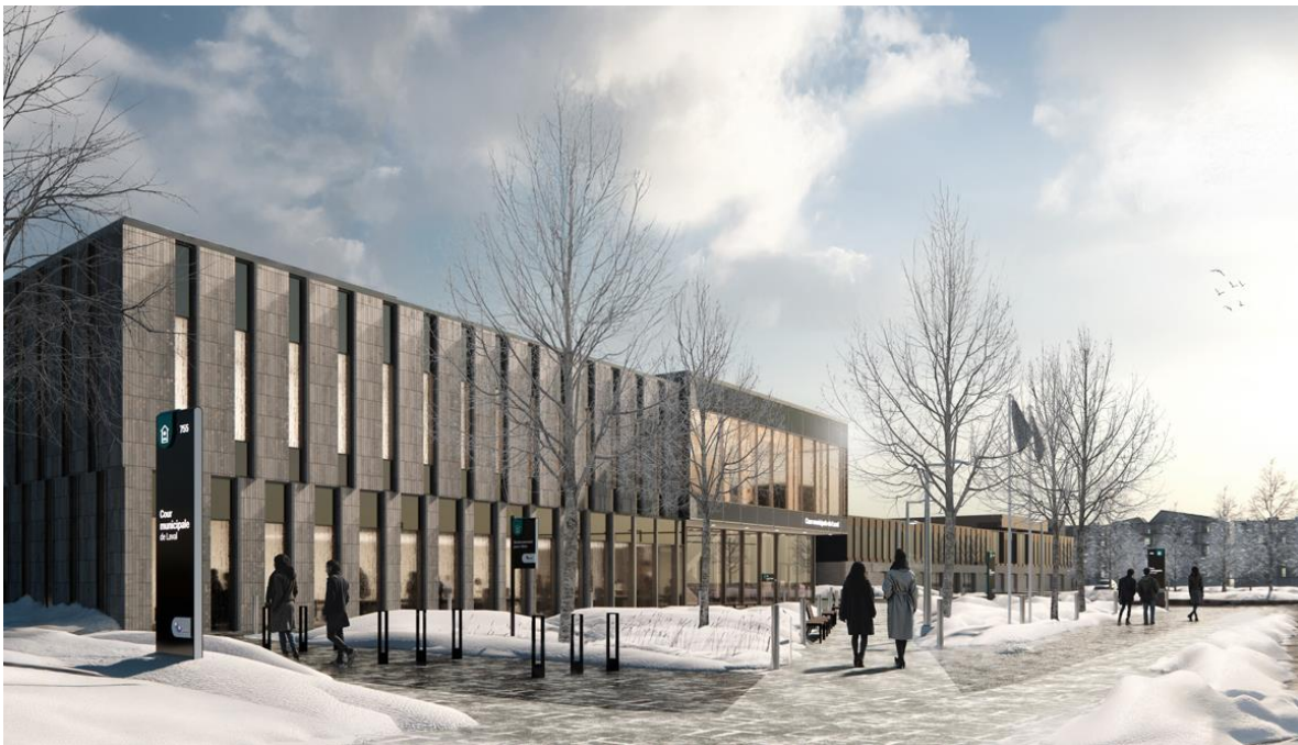
Image 7 – Vue sur la devanture et le parvis de la cour municipale en hiver.