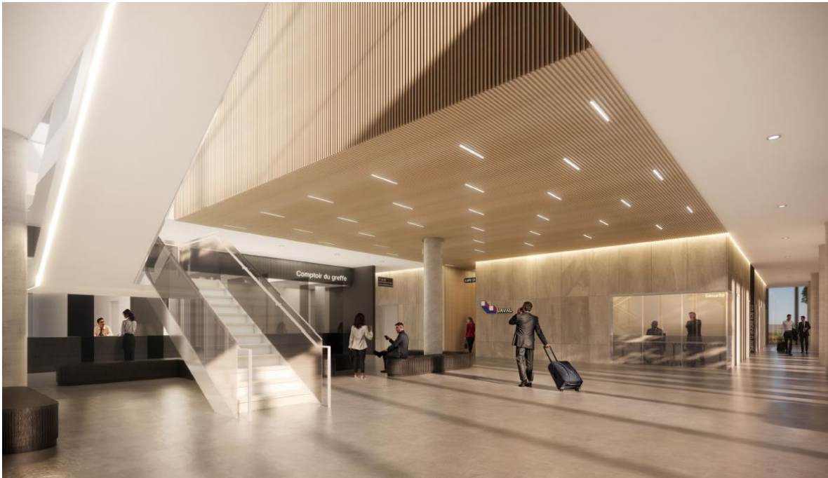
Image 10 – Vue intérieure. Au rez-de-chaussée, la salle des pas perdus et l’escalier monumental.