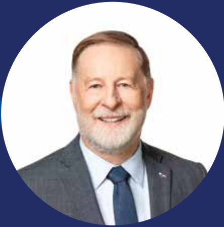
Marc Demers Maire de Laval