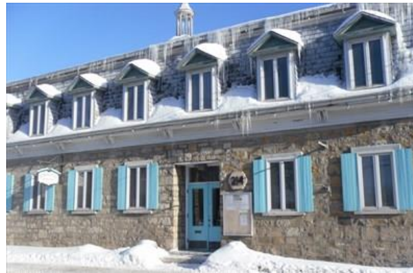
CENTRE D'ART DE SAINTE-ROSE 214, BOUL. SAINTE-ROSE