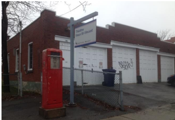
THÉÂTRE DU VIEUX-SAINT-VINCENT 1086, AV. DU COLLÈGE