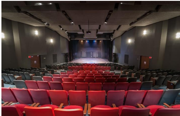
Théâtre des Muses

Le programme d'accès à la Maison des arts est une occasion pour les organismes de loisir culturel de diffuser dans un contexte professionnel et avec une équipe dédiée. Ce programme offre un accès prioritaire, dans des périodes dédiées en automne et au printemps, et une aide financière sous forme de rabais à la location, aux services et aux équipements spécialisés. La période de dépôt se fait en début de chaque année, pour les réservations de l'automne et du printemps suivant.