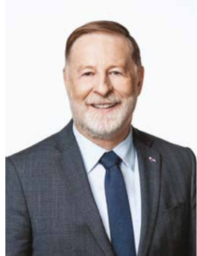
Marc Demers Maire de Laval

Porteur d'une vision inspirante, ce plan marque un virage. Les prochaines années témoigneront de notre engagement envers la culture, véritable catalyseur pour nourrir la fierté d'être Lavallois et renforcer le statut de Laval, 3 e grande ville du Québec.