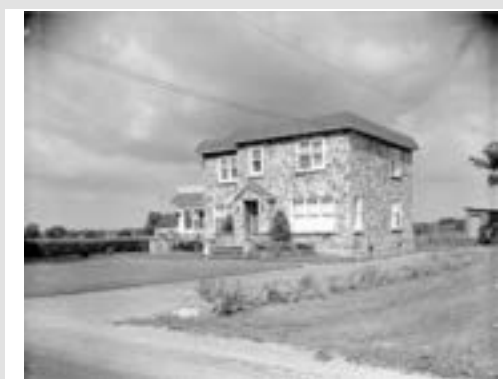
109, St-Elzéar Est, Vimont, vers 1950