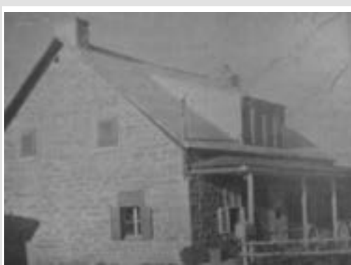
175 bl St-Elzéar Est