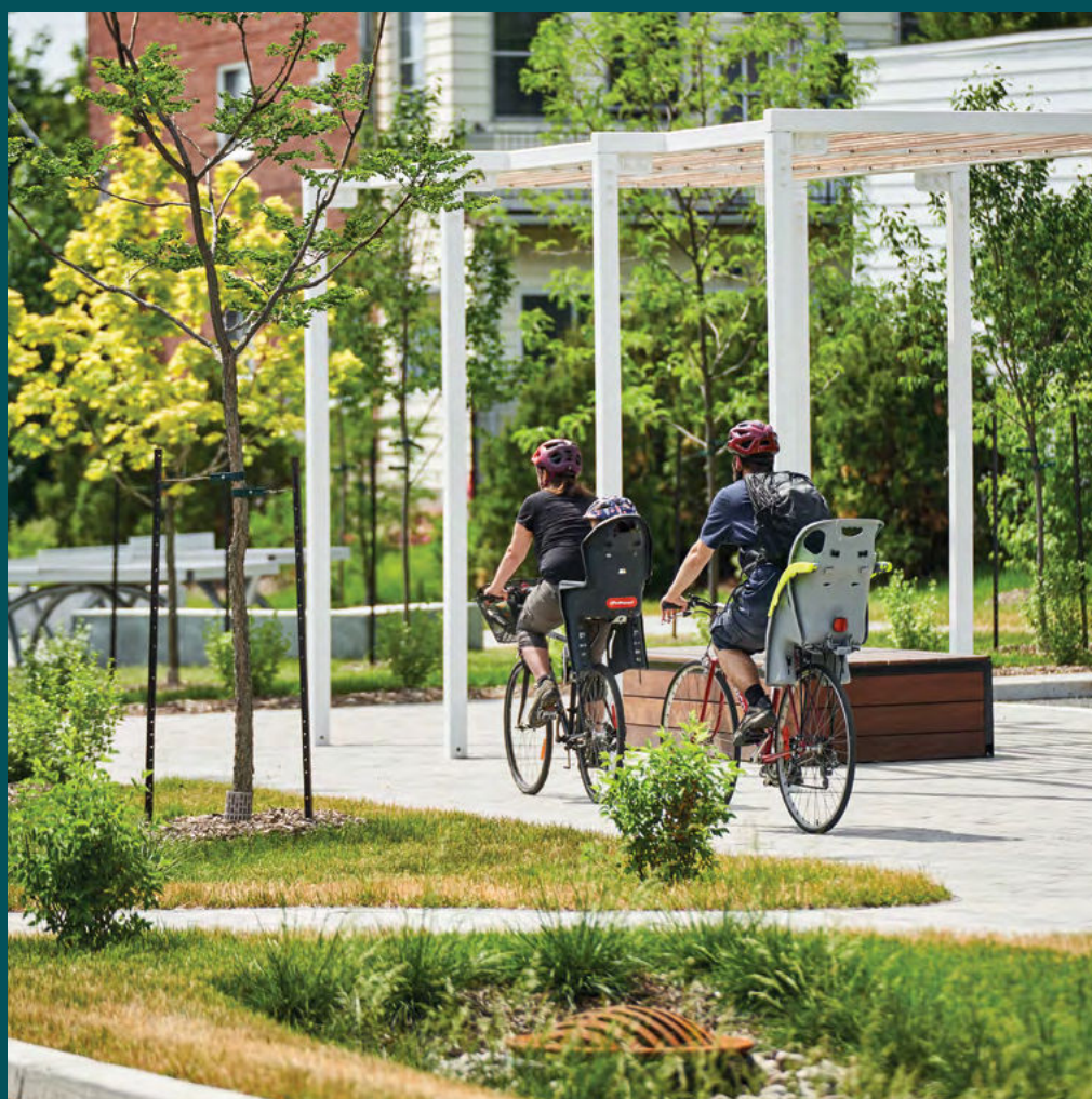
Parc Dufresne