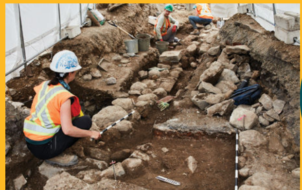
Une partie des vestiges d'un ancien hôtel mis au jour par les archéologues.

📍 laval.ca , sous l'onglet Citoyens/Urbanisme/Haltes estivales