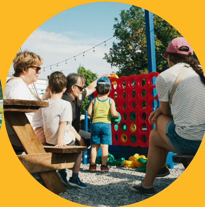
Projet Oasis Cartier.