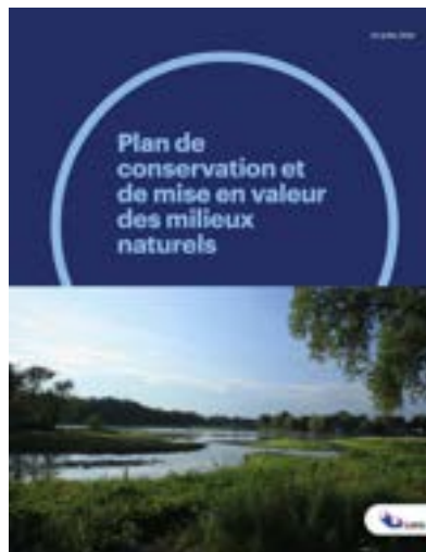
© Sylvain Majeau/ Ville de Laval → Le Plan de conservation et de mise en valeur des milieux naturels a été adopté par la Ville de Laval en 2020.