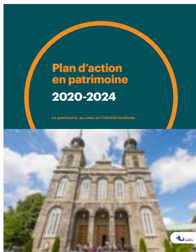
© Vincent Girard/ Ville de Laval → Le Plan d'action en patrimoine a été adopté par la Ville de Laval en 2020.

Le Plan de conservation et de mise en valeur des milieux naturels a aussi été adopté, un pas important vers la protection, l'accès et la mise en valeur du patrimoine naturel. À terme, 14 % du territoire lavallois sera protégé grâce à ce plan. De plus, deux grandes îles de la rivière des Mille-Îles (îles aux Vaches et îles Saint-Pierre) ont été acquises par la Ville de Laval en 2020.