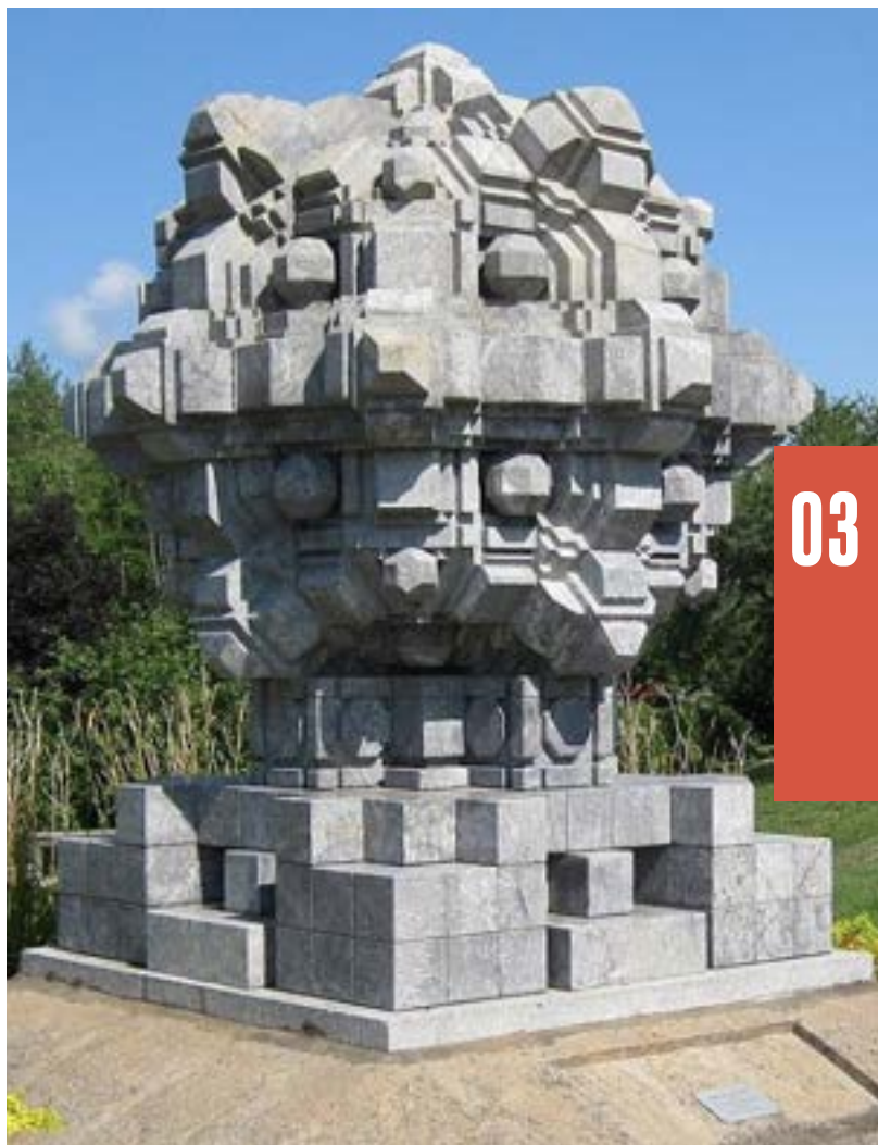
Trois dimensions Urzelle de Fritz Hartlauer. Œuvre vestige de l'Exposition universelle de Montréal de 1967, restaurée en 2020 et exposée au Centre de la nature.