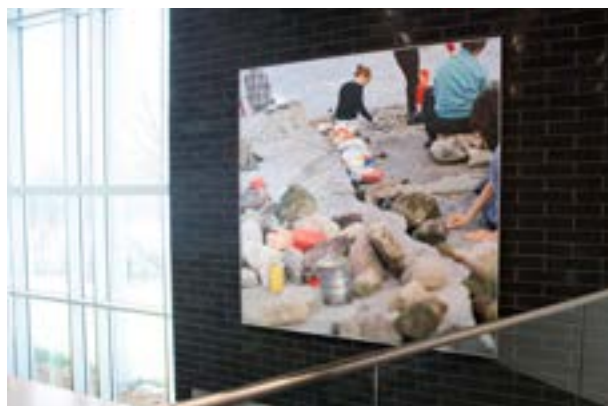
© Jacynthe Carrier → Les magiciens de Jacynthe Carrier, œuvre intégrée au Centre communautaire Sainte-Dorothée.

Dix œuvres de la collection d'art public municipale ont fait l'objet d'une restauration. Un travail d'envergure, qui a redonné ses lettres de noblesse à ces œuvres placées dans de grands parcs et lieux culturels lavallois.