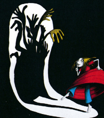
Illustration: Gigi Perron