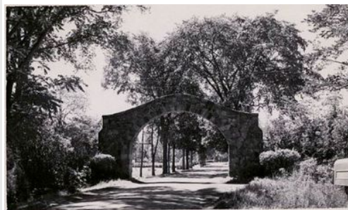
Porte de Laval-sur-le-Lac