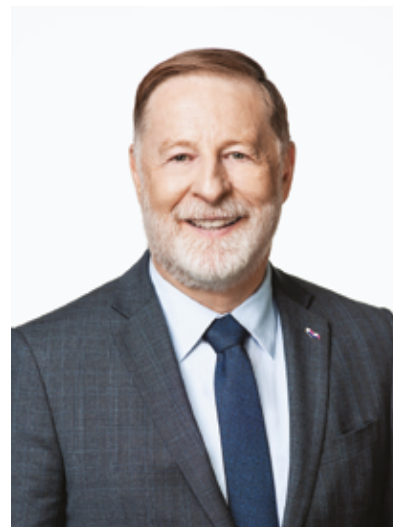
Marc Demers Maire de Laval

Porteur d'une vision inspirante, ce plan marque un virage. Les prochaines années témoigneront de notre engagement envers la culture, véritable catalyseur pour nourrir la fierté d'être Lavallois et renforcer le statut de Laval, 3 e grande ville du Québec.