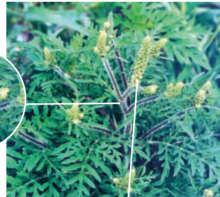
Un épi verdâtre...